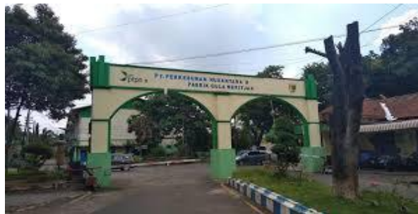
Gambar 1. Foto PT. Pabrik Gula Meritjan

Pabrik Gula Meritjan adalah salah satu dari 11 unit usaha industri dibawah naungan PT Perkebunan Nusantara X yang memiliki kegiatan mengolah bahan baku tebu menjadi produk gula putih dengan kualitas SHS (Superior Hoofd Suiker). Pabrik Gula Meritjan bertujuan untuk memenuhi kebutuhan gula nasional atau dalam negeri serta menyongsong tercapainya program swasembada gula melalui akselerasi peningkatan produktifitas. Disamping itu, Pabrik Gula Meritjan PT Perkebunan Nusantara X Kota Kediri juga menghasilkan produk samping berupa tetes tebu yang merupakan bahan baku pembuatan penyedap rasa dan alkohol atau