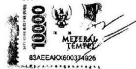
Leo Rizki Mubarak

Surabaya, 21 September 2023 yang menyatakan,