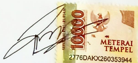
Rifky Alif Puspita