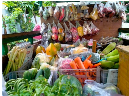
Gambar Sayur Dagangan