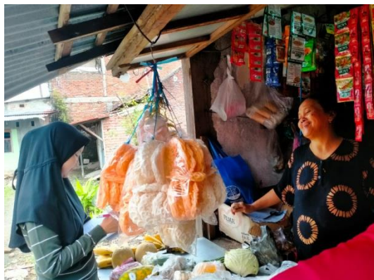
Gambar Dokumentasi Wawancara dengan Pedagang Sayur Menetap