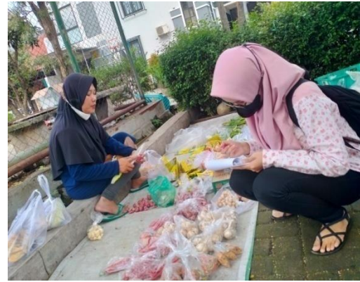
Gambar Dokumentasi Wawancara dengan Pedagang Sayur Menetap