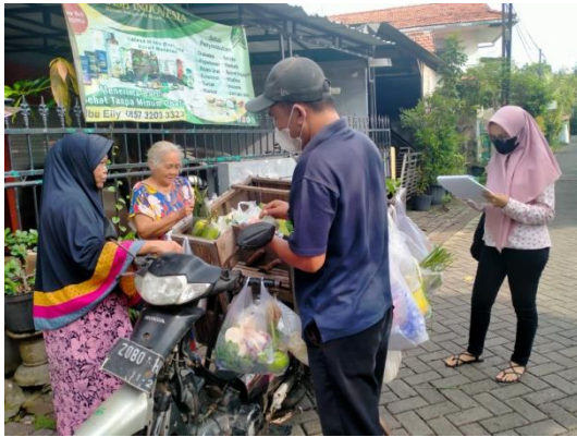
Gambar Dokumentasi Wawancara dengan Pedagang Sayur Keliling