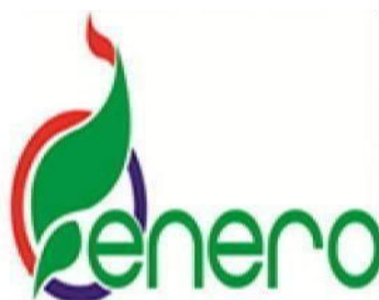
Gambar 1.1 Logo Perusahaan PT. Energi Agro Nusantara

Logo pada pabrik ini terdiri dari tiga warna, yaitu dominasi hijau, merah, dan biru. Secara umum masing-masing melambangkan harmoni, semangat, dan inovasi. Sedangkan filosofi dari bentuk besar berwarna hijau, menggambarkan daun yang mencerminkan bahwa PT. Energi Agro Nusantara bergerak di bidang energi terbarukan (bioethanol) dengan bahan baku tetes tebu dan berkontribusi untuk selalu menjaga lingkungan. Bentuk kecil berwarna hijau melambangkan tetesan air yang berarti bahwa bioethanol merupakan produk cair hasil dari penyulingan dan fermentasi tetes tebu dengan mutu fuel grade yang menjadikan Enero sebagai produsen bioethanol terkemuka skala nasional.