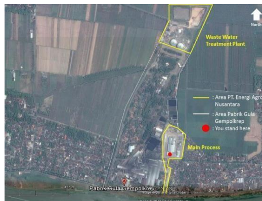
Gambar 1.2 Lokasi PT. Energi Agro Nusantara

PT Energi Agro Nusantara berlokasi di daerah Gempolkrep, Mojokerto, Jawa Timur dengan luas lahan sekitar 6,5 hektar. satu lokasi Water Treatment Process dan produksi dan satu lokasi pengolahan limbah (WWTP) yang terletak disebelah pabrik gula Gempolkrep. Hal ini dikarenakan bahan baku dari pembuatan bioetanol berupa molase berasal dari pengolahan pabrik gula dan daerah tersebut dekat dengan sumber air yaitu Sungai Brantas. Sejak berdirinya PT. Energi Agro Nusantara hingga saat ini belum ada perluasan wilayah perusahaan. Tetapi ada rencana untuk mendirikan anak perusahaan yang juga akan bergerak dibidang yang sama yaitu pengolahan tetes tebu ( molasses ) menjadi bioethanol. Rencana pendirian anak perusahaan berada di daerah Kediri Jawa Timur, namun saat ini masih dalam tahap studi kelayakan wilayah dan sumber daya.