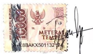
Tiffara Indah Nur Fauziyyah