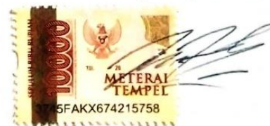
Alfin Fitra Perdana

Surabaya, 13 September 2023 Yang menyatakan,