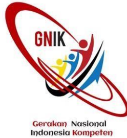
Gambar 2.1 Logo Gerakan Nasional Indonesia Kompeten

Banyak fresh graduate ketika mereka lulus menjadi pengangguran, ini disebabkan karena mereka tidak memiliki skill dan keterampilan (kompetensi) yang dibutuhkan oleh perusahaan. Link and Match dunia industri dan perguruan tinggi selalu menjadi masalah besar. GNIK ingin berkontribusi memberikan solusi bagi masalah ini yaitu dengan program studi independen bersertifikat Soft Skills & Manajemen SDM , Program ini didesain oleh para expert di bidang SDM. Gerakan Nasional Indonesia Kompeten (GNIK) adalah sebuah platform terbuka berskala nasional yang bertujuan untuk merangkul semua pemangku kepentingan yang terkait dengan Pengembangan Sumber Daya Manusia (Pemerintah, Asosiasi Pekerja, APINDO, KADIN, BNSP, Universitas, dan lain-lain) untuk berkolaborasi dan bekerja sama untuk meningkatkan kapabilitas Sumber Daya Manusia dan mendorong daya saing tenaga kerja secara nasional. Sejak diinisiasi GNIK telah secara aktif membangun komunikasi dan kolaborasi dengan seluruh praktisi Sumber Daya Manusia di Indonesia, diawali dengan inisiasi gerakan dari Forum Praktisi HR Senior Indonesia, Gerakan ini saat ini telah mengundang partisipasi asosiasi-asosiasi dan komunitas HR dari seluruh wilayah Indonesia. Gerakan ini juga ditujukan untuk mendukung percepatan implementasi Kampus Merdeka dengan mengajak partisipasi Industri bersama-sama terlibat dalam aksi nyata dalam program peningkatan keterampilan dan kompetensi angkatan kerja.