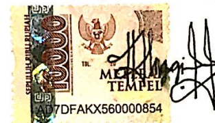
Anggi Eva Ariesti

Surabaya, 01 September 2023 yang menyatakan,