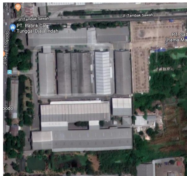
Gambar I.1. Lokasi Pabrik Cat Tunggal Djaja Indah

PT. Pabrik Cat Tunggal Djaja Indah berlokasi di jalan Letjen Suprpto No.26, Kepuh, Tambakrejo, Kecamatan. Waru, Kabupaten Sidoarjo, Jawa Timur 61256. Pabrik cat ini berdiri di atas tanah seluas ±6 hektar. Denah lokasi PT. Pabrik Cat Tunggal Djaja Indah dapat dilihat pada Gambar I.2.