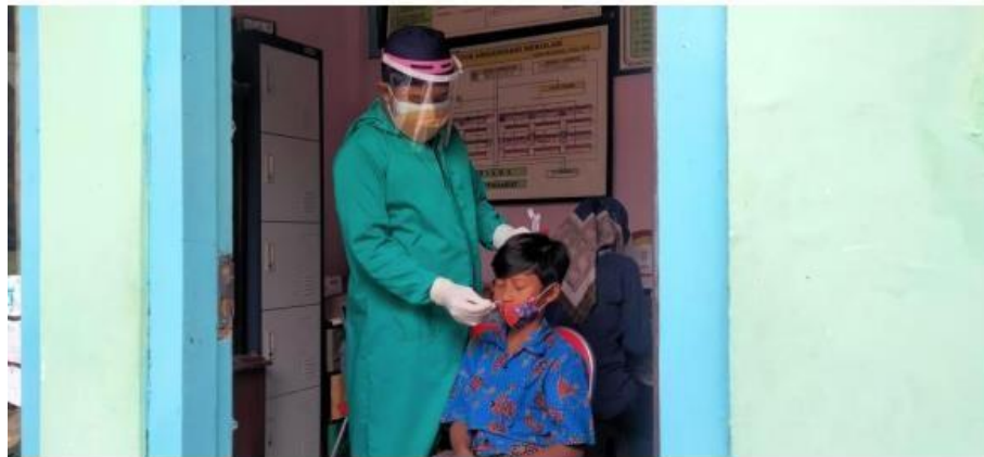
( menemani siswa/siswa SD Fajar Jaya SWAB )