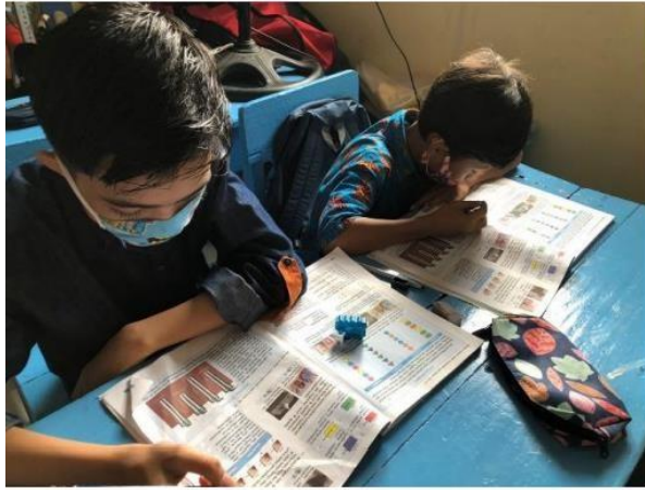
( mengerjakan soal AKM )