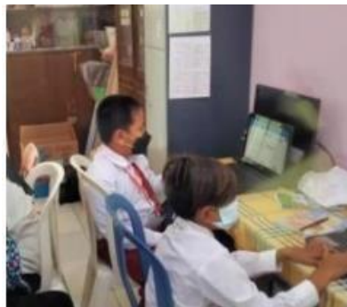
(Hari keempat simulasi ANBK untuk sesi 1 tahap numerasi )