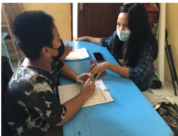
( Mengajar siswa kelas 5 )