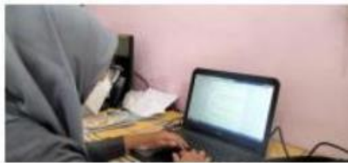
( mengisi kuisioner terkait supervise sekolah SD Fajar Jaya)