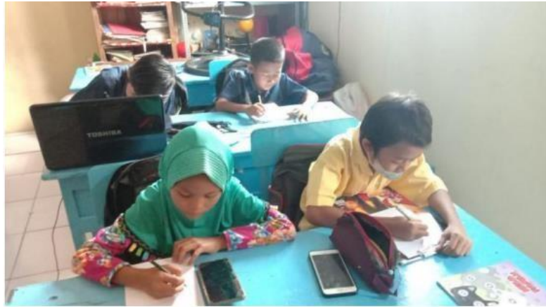
( mengawasi para siswa/siswi kelas 5 yang sedang mengerjakan PAS )