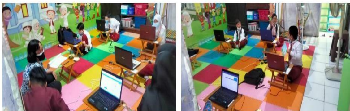
( mengawasi ujian ANBK kelas 5 )