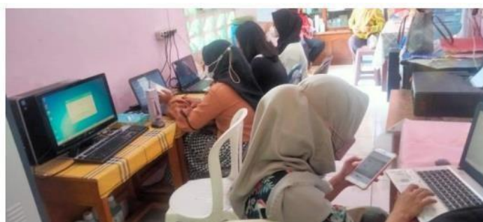
( membuat jadwal simulasi ANBK )