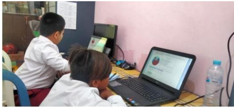
(Hari ketiga simulasi ANBK untuk sesi 1 tahap literasi)