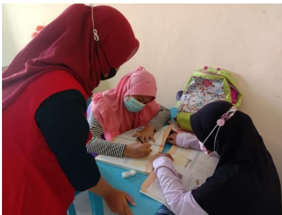
( Mengajar siswa kelas 3 )