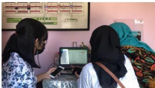
( Melengkapi adminitrasi persiapan ANBK )