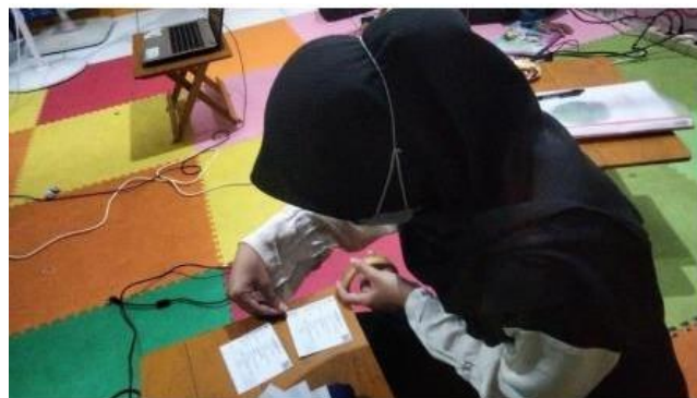
( memasang nomer ujian di bangku siswa )