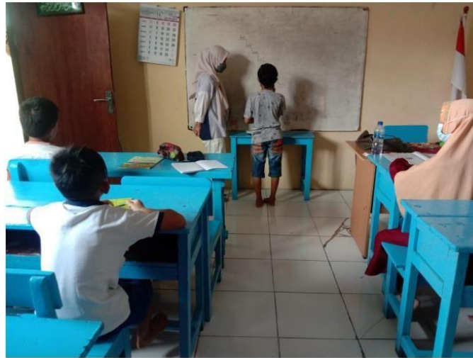
( kegiatan belajar mengajar di kelas 5 )