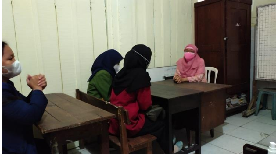
( Koordinasi dengan pihak sekolah )