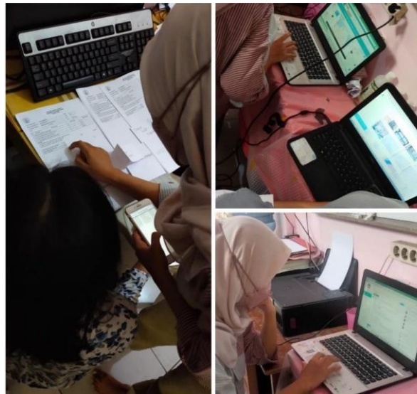
( persiapan AKM untuk minggu depan )