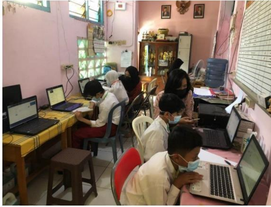
(Hari kedua simulasi ANBK untuk sesi 1 tahap numerasi)