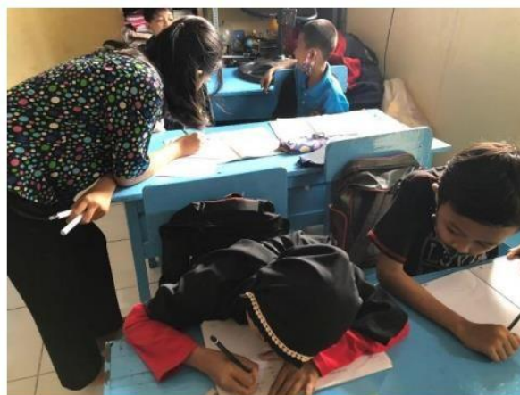
( kegiatan belajar mengajar bersama kelas 5 )