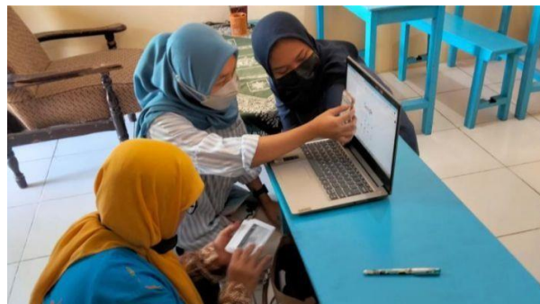
(Membimbing guru dalam adaptasi teknologi)