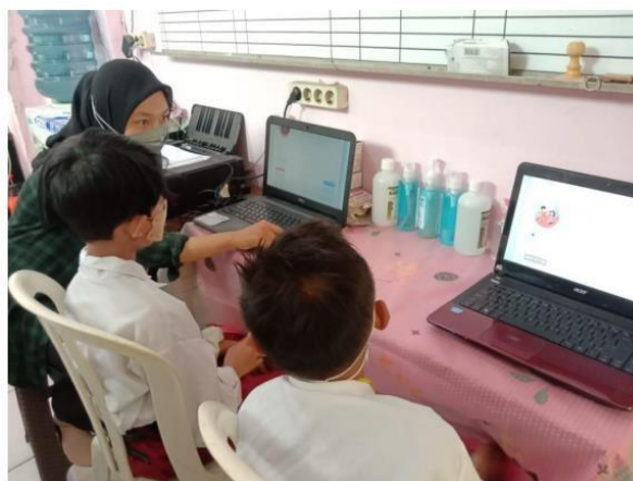
( Hari pertama simulasi ANBK untuk sesi 1 tahap literasi )