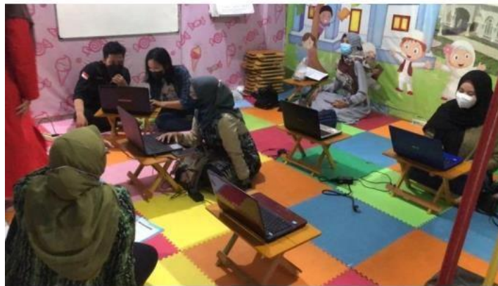
( melakukan simulasi ANBK oleh guru dan mahasiswa )