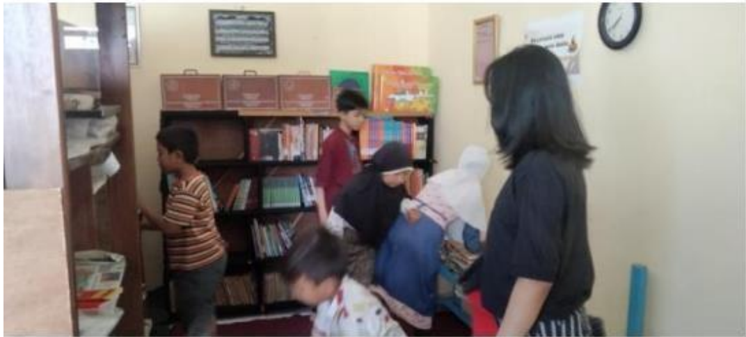
( bersih-bersih perpustakaan dan menanta ulang buku )