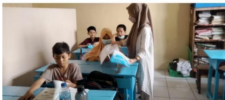
( kegiatan belajar mengajar di kelas 5 )