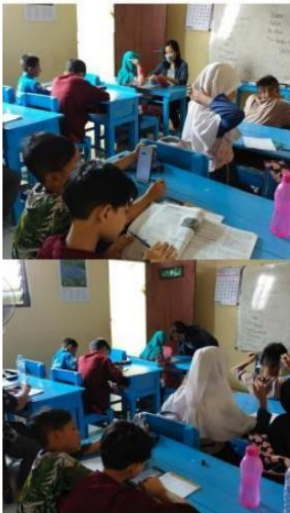
( mengawasi para siswa/siswi kelas 5 yang sedang mengerjakan PAS )