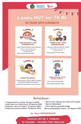
(Flyer penginfomasi lomba)