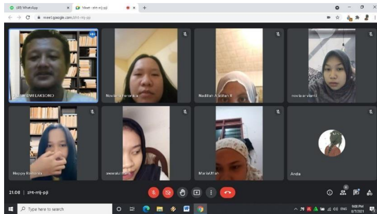
( Koordinasi dengan DPL )