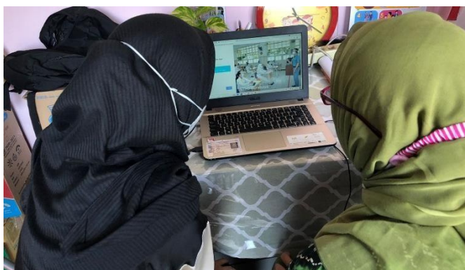
(Membantu pengerjaan administrasi PTM di web STMJ Surabaya)