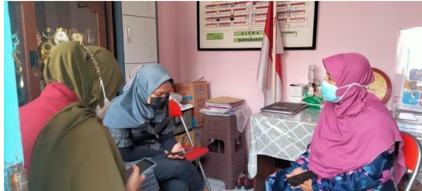
(Mengikuti pembelajaran secara daring)