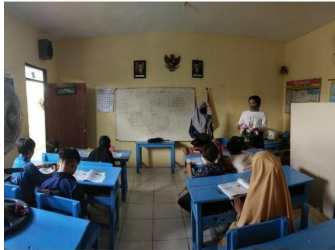
( pembelajaran Numerasi kelas 5 oleh mahasiswa kampus mengajar )