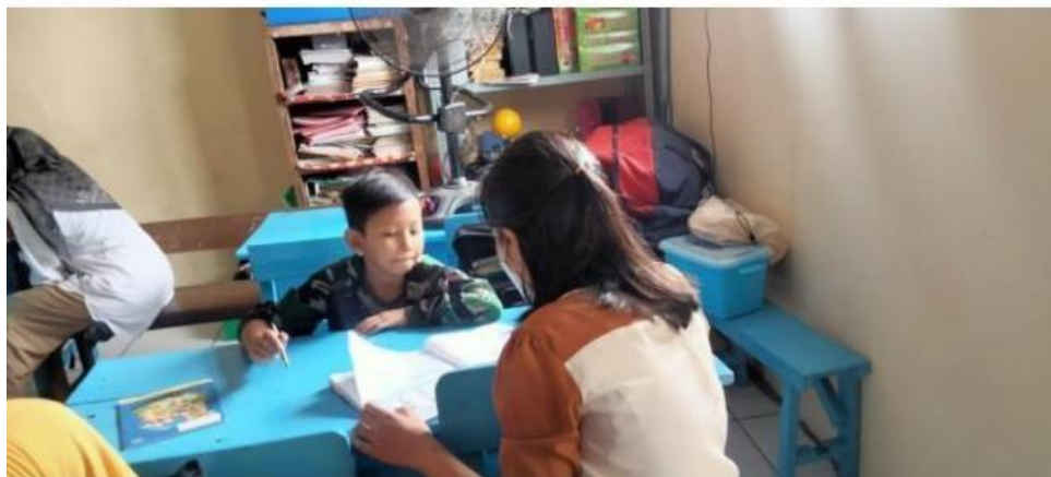
( membantu siswa yang kesulitan dalam mengerjakan soal )