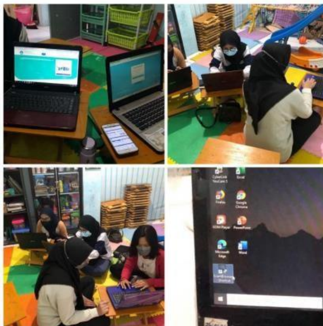
( Mengunduh aplikasi ANBK di laptop server untuk siswa )