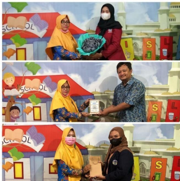
( Perpisahan dan pemberian kenang-kenangan kepada SD. Fajar Jaya )