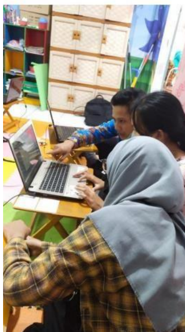
( membuat berita acara setelah ujian berlangsung )