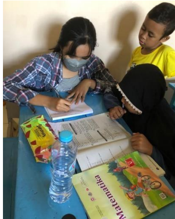
( Mengajar siswa kelas 5 )