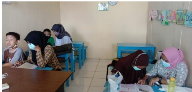
( Mengajar siswa kelas 3 )