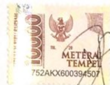
Diva Rachelia Erlangga