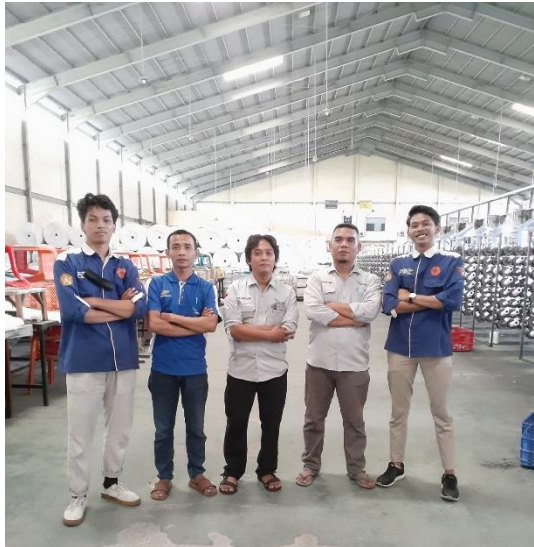
Gambar 4. Foto Bersama Staff Divisi Quality Control Pada Saat Inspeksi Harian