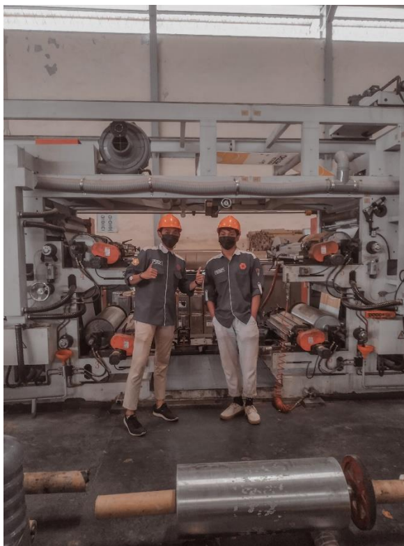
Gambar 5. Foto Pada Saat Inspeksi Pada Mesin Printing Golden Jason