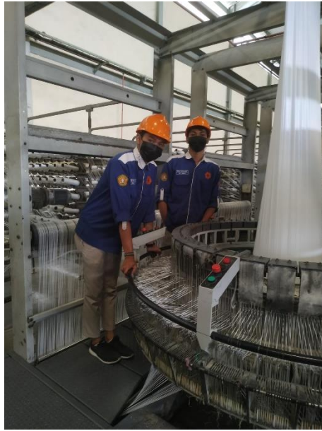
Gambar 6. Foto Di Bagian Mesin Circular Loom