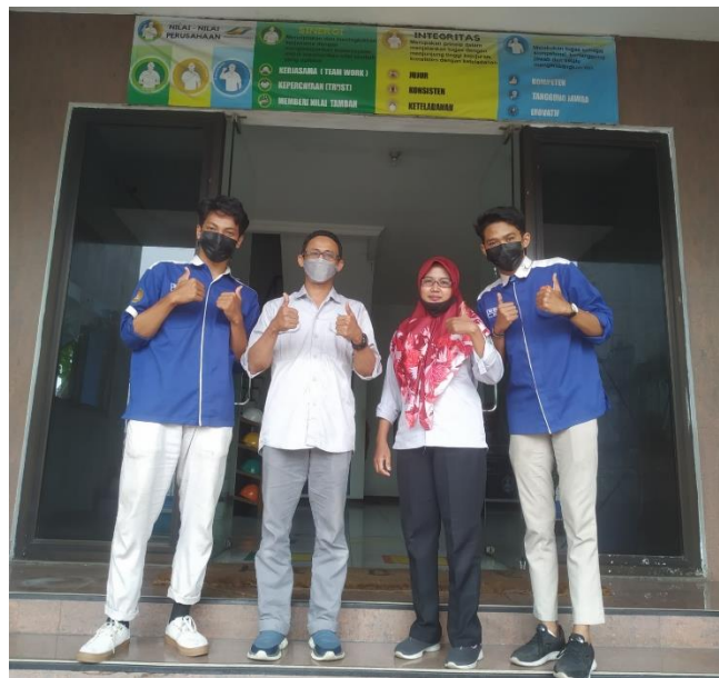
Gambar 7. Foto Dengan Pembimbing Lapangan