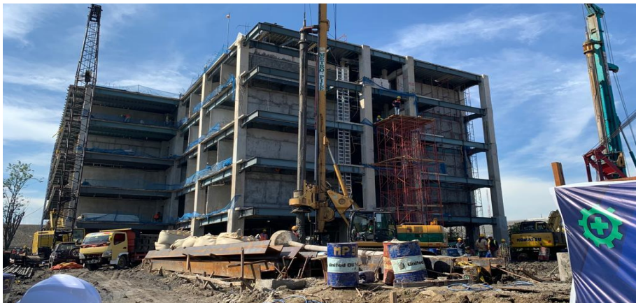
Gambar 1.2 Lokasi Proyek Tampak Samping