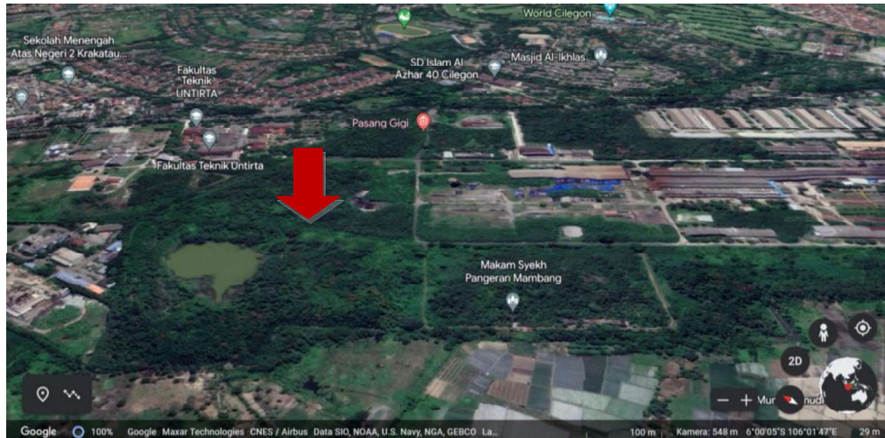
Gambar I.1 Rencana Pabrik Calcium Chloride

Adapun alasan pemilihan lokasi tersebut karena dengan mempertimbangkan faktor-faktor utama dan faktor-faktor pendukung. Antara lain: