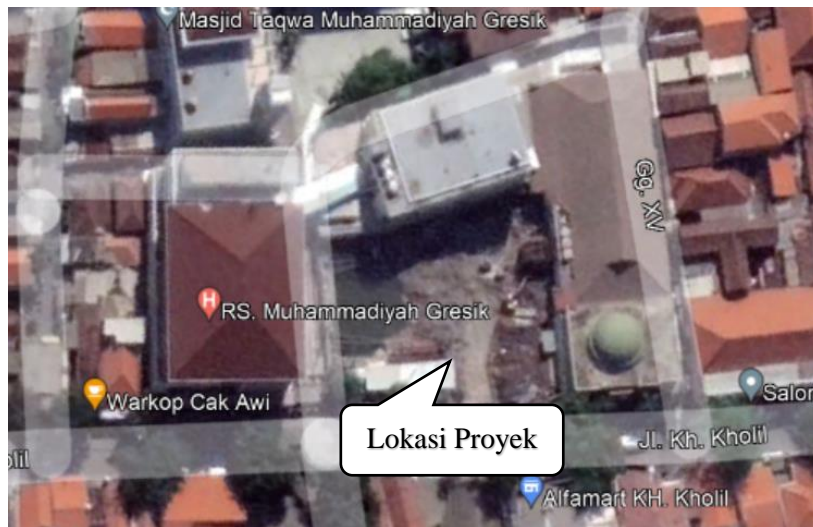
Gambar 1. 1 Peta Lokasi Proyek Pembangunan Rumah Sakit Muhammadiyah Gresik