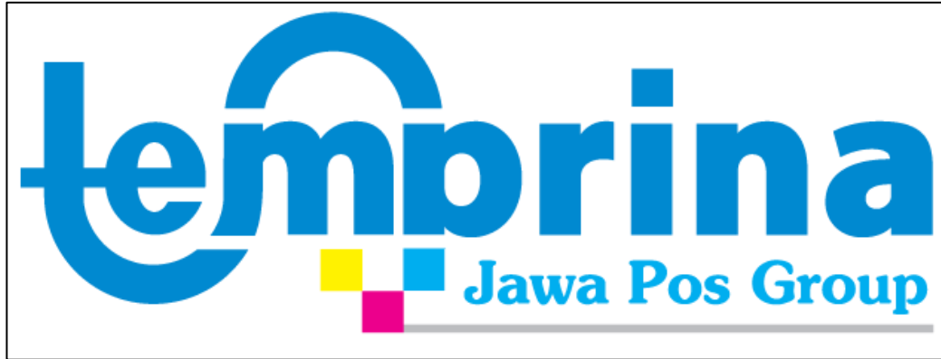
Gambar II.1. Logo PT Temprina Media Grafika

Berdirinya PT Temprina Media Grafika tidak bisa dilepaskan dari PT Jawa Pos. Perkembangan PT Jawa Pos yang pesat perlu didukung oleh adanya layanan percetakan yang mampu mendukung aspek mutu atau kualitas, ketepatan waktu, dan jumlah sesuai yang diminta. Oleh karena itu, bagian percetakan yang awal mulanya merupakan bagian dari departemen produksi PT Jawa Pos kemudian dipisah menjadi perusahaan berbadan hukum sendiri dengan Akta Pendirian Perusahaan tertanggal 29 November 1996. Pertimbangan lain didirikannya PT Temprina Media Grafika yaitu: