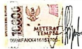
Saniyah Azzaliyah Putri