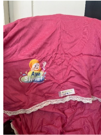
Gambar 85 mukenah anak