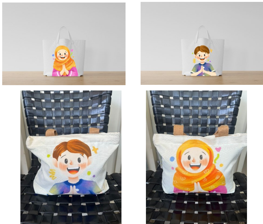
Gambar 92 Totebag

Media totebag ditambahkan sebagai tempat ketika anak pergi ke luar lingkungan rumah seperti di sekolah, mereka dapat membawa perlengkapan ibadah mereka atau sebagai penyimpanan lainnya. Di dalam desain totebag ini, didesain dengan 2 karakter laki-laki sendiri dan karakter perempuan sendiri yang di bagian sisi lainnya ditambahkan judul buku perancangan.