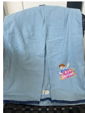
Gambar 86 Sarung anak