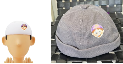
Gambar 87 Peci anak