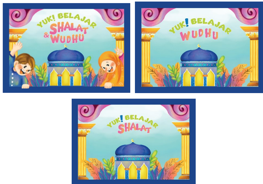
Gambar 83 Desain cover buku

Dalam perancangan ini, sebelum membuat halaman buku terlebih dahulu membuat sebuah rancangan desain cover buku depan dan belakang. Di dalam cover buku perancangan ini didesain 3D dengan menggunakan potongan desain background yang di tempel bertumpuk seakan menciptakan ilusi 3D. Penambahan 2 karakter laki-laki dan perempuan dengan ciri khas masjid bersama pilar di berikan di setiap pojok kanan dan kiri. Dengan tambahan judul “Ayo! Belajar Shalat & Wudhu” diberikan ditengah halaman agar mudah menjadi highlight utama.