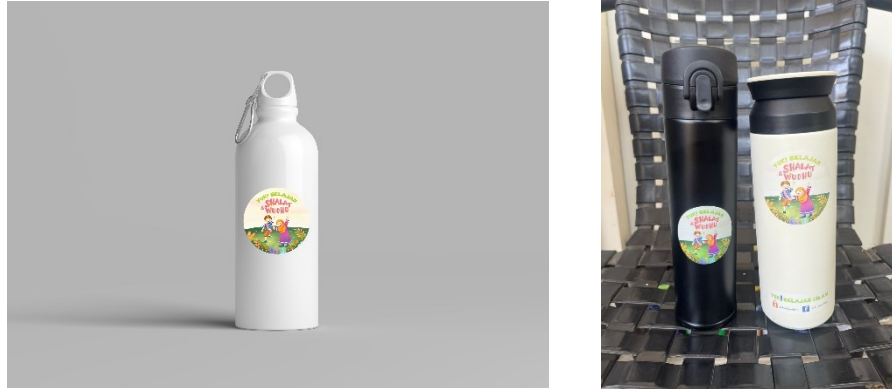
Gambar 89 Botol tumbler

Media tumbler minuman digunakan sebagai penyimpanan air saat audience sedang beraktifitas diluar rumah dan di area sekolah. Dalam rancangan desain tumbler minuman ini dibuat 2 karakter laki-laki dan perempuan yang ada dalam buku perancangan dan judul buku.