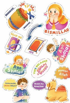
Gambar 90 Steiker

Media sticker merupakan media yang pantas diberikan kepada audience. Karena pada usia dini, anak masih sering bereksplorasi sambil bermain. Dengan pemilihan media ini, dan didesain dengan beberapa karakter yang ada dalam buku dengan beberapa kata sebagai pengingat shalat.