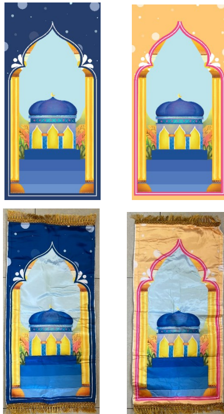
Gambar 88 Sajadah

Media pendukung sajadah dipakai karena ketika sajadah merupakan alat penting dalam shalat. Didalam desain sajah, penulis mendesain dengan mengambil beberapa unsur yang ada dalam cover perancangan sebagai identitas dan ciri khas buku perancangan ini.