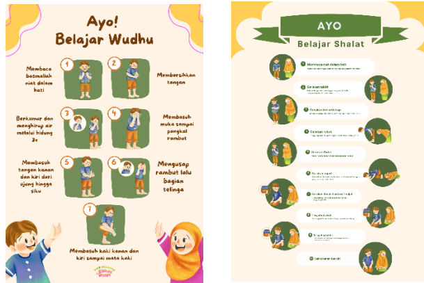
Gambar 91 Desain poster