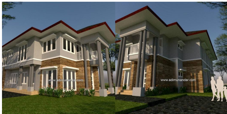
Gambar 2.4 Proyek Bangunan Residence

Proyek pembangunan Villa di Trawas merupakan salah satu proyek CV. Adi Munandar & Associates. Konsep desain pada Villa dibuat dengan mengubah tampilan rumah klasik menjadi tropis moderen. Perubahan desain dengan mengubah detil kolom, melebarkan atap utama & menambahkan unsur batu alam.