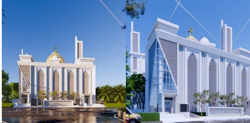
Gambar 2.3 Proyek Bangunan Sosial

Proyek pembangunan Citra Harmoni Sidoarjo adalah salah satu proyek yang dikerjakan CV. Adi Munandar & Associates di Sidoarjo. Bangunan ini termasuk bangunan social berupa tempat peribadatan, yaitu Masjid.