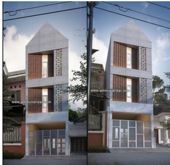
Gambar 2.5 Proyek Bangunan Residence

Proyek pembangunan rumah kos dengan konsep modern yang juga merupakan salah satu proyek CV. Adi Munandar & Associates. Bentuk modern dengan garis lurus yang kuat. Memiringkan dinding ke dalam untuk mendapatkan bentuk yang tidak flat. Material batu bata ekspose, dinding unfinished & penggunaan roster menjadikan tampil moderen & unik.