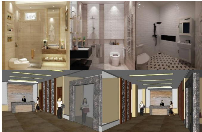
Gambar 2.6 Proyek Interior