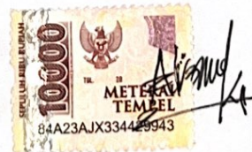
Niniet Tasya Violita