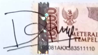
Ayu Nur Fadillah