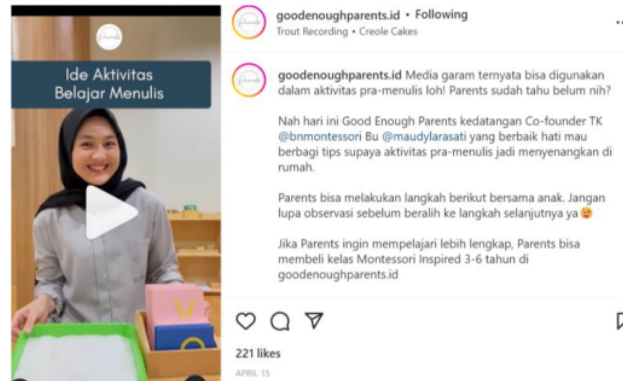
Gambar 4 Ide aktivitas belajar menulis

Pada salah satu contoh data gambar 4 unggahan tanggal 15 April 2022 adalah kategori stimulasi belajar. Kategori ini termasuk pada bagian konsep identifying long-term goals dalam konsep dasar positive discipline . Konsep tersebut merupakan rumusan tujuan yang akan dicapai orang tua ketika anak beranjak dewasa. Didapatkan melalui pembelajaran-pembelajaran sederhana yang bermanfaat [17]. Konsep identifying long-term goals muncul dalam setiap unggahan konten yang membahas informasi terkait kegiatan yang dapat dilakukan untuk merangsang kinerja otak anak dan meningkatkan kemampuan anak. Selain itu juga ditampilkan bahasan tanda-tanda anak mengalami permasalahan dalam proses belajar.