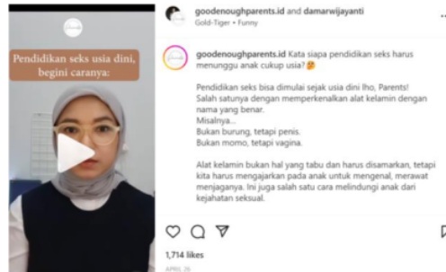
Gambar 2 Pendidikan seks usia dini, gimana caranya?