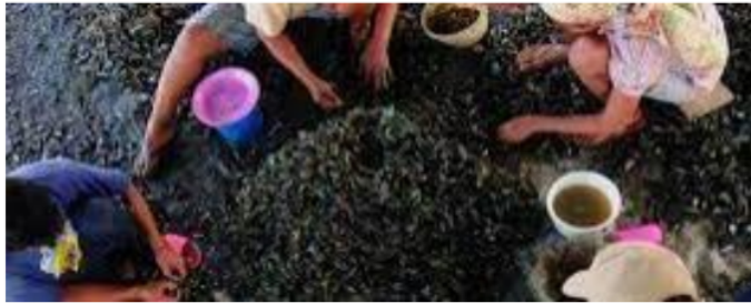
Gambar: Kegiatan Pengupasan Kerang di Desa Segoro Tambak

17 pada musim-musim tertentu saja. Untuk memenuhi kebutuhan sehari-hari, istri nelayan ikut mencari nafkah sebagai tambahan penghasilan keluarga, antara lain melakukan kegiatan mengupas kerang, krupuk kerang maupun pembuatan abon kerang. Desa Segoro Tambak dikenal dengan hasil tambak dan sumber kerang yang banyak dihasilkan nelayan, sehingga Kota Sidoarjo disamping sebagai kota udang juga terkenal dengan makanan khas tradisionalnya yaitu lontong balap dan sate kerangnya. Namun abon kerang sebenarnya juga punya potensi untuk dikembangkan. Melihat potensi ini, maka para wanita pesisir tergerak untuk mengolah hasil tangkapan nelayan antara lain kerang yang dioleh untuk menjadi “abon kerang” sebagai sumber penghasilan tambahan keluarga. Hal-hal seperti ini menjadikan upaya-upaya pemberdayaan atau intervensi yang dilakukan untuk mensejahterakan keluarga nelayan perlu dititikberatkan pada kemampuan wanita yang ada disana.