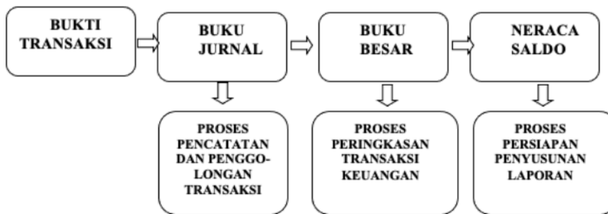
Gambar: Proses Akuntansi

Pengelolaan Keuangan Sederhana Untuk Usaha Kecil Ada beberapa pengertian mengenai pembukuan/akuntansi yaitu: akuntansi adalah seni pencatatan, penggolongan, peringkasan dan pelaporan transaksi-transaksi keuangan suatu organisasi dengan cara tertentu yang sistematis, serta penafsiran terhadap hasilnya. Obyek kegiatan akuntansi adalah transaksi-transaksi keuangan, yaitu peristiwa-peristiwa atau kejadian-kejadian yang setidaknya-tidaknya bersifat keuangan misalnya penerimaan uang, pengeluaran uang, pembelian, penjualan yang bertujuan untuk memperoleh keuntungan. Proses akuntansi dapat digambarkan sebagai berikut: