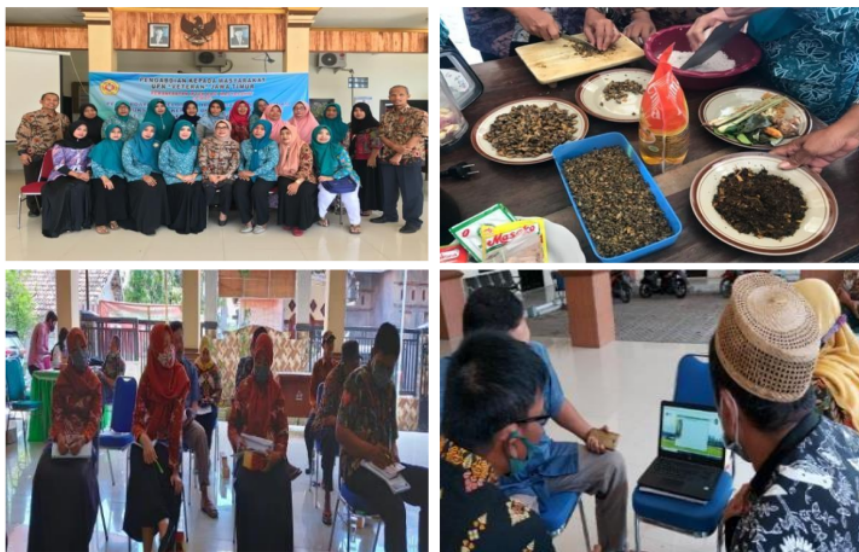
Gambar: Pelatihan usaha produksi abon kerrang, Pembukuan Sederhana dan Promosi di Balai Desa Segoro Tambak, Sedati, Sidoarjo

Kegiatan pengabdian masyarakat berjudul “Pemberdayaan Kelompok Ibu RumahTangga dalam Produksi Abon Kerang dan pembukuan sederhana Di Desa Segoro Tambak Kecamatan Sedati Kabupaten Sidoarjo yang dilakukan di Balai Desa Segoro Tambak Kecamatan Sedati Kabupaten Sidoarjo pada hari Rabu, tanggal 3 Juli 2021. Kegiatan tersebut melibatkan ibu-rumah tangga yang tergabung dalam Kelompok Wanita Pesisir berjumlah 50 orang. Kegiatan yang berlangsung selama tiga jam ini terbagi atas tiga sesi, yaitu pelatihan produksi pembuatan abon kerang, pelatihan pembukuan sederhana dan diskusi mengenai potensi kegiatan pemasaran yang dapat mereka lakukan. Pelatihan ini diselenggarakan dalam bentuk penyuluhan dan praktek yang diberikan oleh tim penyuluh dari Tim Pikat Abdimas UPN “Veteran” Jawa Timur.