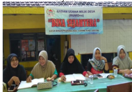
Gambar 1. Kegiatan Rutin BUM Desa Bina Sejahtera

Penelitian ini menggunakan tipe penelitian deskriptif kualitatif yang berguna untuk memberi gambaran rinci mengenai Analisis Kapasitas Manajemen Kewirausahaan Dalam Badan Usaha Milik Desa “Bina Sejahtera” di Desa Dadapkuning Kecamatan Cerme Kabupaten Gresik. Teknik penentuan informan dilakukan dengan teknik purposive dan non-probability sampling . Teknik pengumpulan data dilakukan dengan teknik observasi, wawancara, dokumentasi. Sedangkan teknik pemeriksaan keabsahan data melalui triangulasi dan observasi secara terus-menerus. Teknik analisis data menggunakan teknik reduksi data, penyajian data, penarikan kesimpulan dan verifikasi. Dadapkuning. Hal ini untuk dapat menjaga keberlangsungan BUM Desa agar tidak mati suri. Pengurus melihat ini sebagai solusi agar tidak seperti BUM Desa kebanyakan yang tidak memiliki kegiatan rutin sehingga lama-lama menjadi tidak terurus dengan baik karena tidak adanya perhatian lebih yang diberikan.