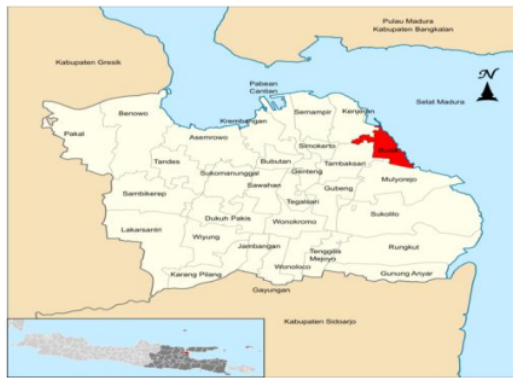
Gambar 1. Peta lokasi penelitian

Penelitian ini dilakukan pada bulan Oktober 2021 hingga Januari 2022 di Kecamatan Bulak Kota Surabaya dan Dinas Ketahanan Pangan dan Pertanian Kota Surabaya (Gambar 1). Dalam penelitian ini penulis menggunakan metode penelitian melalui pendekatan kualitatif dengan jenis deskriptif.