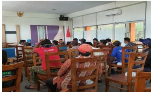
Gambar 3. Sosialisasi dan pendampingan program Kartu KUSUKA di Kecamatan Bulak

Kegiatan sosialisasi dan pendampingan yang telah dilaksanakan tidak memberikan dampak yang terlalu kuat untuk pemahaman masyarakat nelayan. Mayoritas pengetahuan masyarakat nelayan di Kecamatan Bulak terkait program Kartu KUSUKA hanya sebatas sebagai identitas nelayan dan pengganti Kartu Nelayan yang sebelumnya telah ada. Para nelayan tidak memahami tujuan, fungsi, manfaat, serta prosedur dalam pelaksanaan program Kartu KUSUKA secara keseluruhan dan mendalam. Banyak dari para nelayan yang tidak mengetahui keterkaitan program Kartu KUSUKA dengan program kelautan dan perikanan lainnya antara lain sebagai persyaratan dalam kepengurusan asuransi nelayan dan juga keterkaitannya dengan jasa-jasa perbankan.