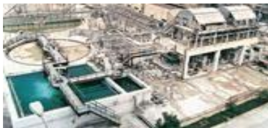
Gambar I.7 Unit pengolahan limbah di PT. Petrokimia Gresik

Sebagai perusahaan berwawasan lingkungan, PT Petrokimia Gresik terus berupaya meminimalisir adanya limbah sebagai akibat dari proses produksi, sehingga tidak membahayakan lingkungan sekitarnya. PT Petrokimia Gresik melakukan pengolahan limbah dengan menggunakan sistem reuse, recycle, dan recovery (3R) dengan dukungan : unit pengolahan limbah cair berkapasitas 240 \text{ m}^3/\text{jam} , fasilitas pengendali emisi gas di setiap unit produksi.