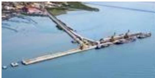
Gambar I.4 Dermaga di PT. Petrokimia Gresik

Dermaga bongkar muat berbentuk huruf T dengan panjang 819 m dan lebar 36 m, mampu disandari sekaligus tiga buah kapal berbobot 10.000 DWT pada sisi darat. Total kapasitas bongkar muat bisa mencapai 7 juta ton/tahun. Dermaga ini dilengkapi dengan fasilitas bongkar muat yang meliputi Continuous Ship Unloader (CSU) untuk membongkar bahan curah berkapasitas 2.000 ton/jam, Multiple Loading Crane yang dapat memuat hasil produksi ke kapal dalam bentuk curah dengan kapasitas 300 ton/jam. Fasilitas lainnya adalah dua buah Cangooroo crane yang merupakan alat bongkar curah dengan kapasitas masing-masing 350 ton/jam, serta belt conveyor dengan panjang keseluruhan mencapai 22 km. Dermaga PT Petrokimia Gresik juga dilengkapi fasilitas untuk bongkar muat bahan kimia cair berkapasitas 60 ton/jam untuk Amoniak dan 90 ton/jam untuk Asam Sulfat. Dan juga memiliki dermaga khusus batubara dengan kapasitas bongkar muat mencapai 480.000 ton/tahun.