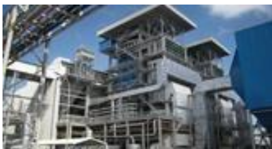
Gambar I.5 Unit utilitas batubara PT. Petrokimia Gresik

Untuk mengantisipasi kesulitan pasokan gas dan kenaikan energi yang susah diprediksi serta melihat kekeayaan bahan baku tambang batubara di Indonesia, maka PT Petrokimia Gresik membangun Proyek Konversi Energi Batubara ini memiliki dua boiler dengan kapasitas masing-masing 150 ton/jam yang bisa menggantikan boiler-boiler di pabrik yang saat ini masih menggunakan BBM. Selain untuk mensuplai kebutuhan listrik ke Pabrik II, pengoperasian Unit Utilitas Batubara juga mampu menghemat penggunaan gas sebesar 6,3 MMSCFD