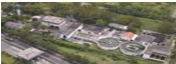
Gambar I.6 Instalasi penjernihan air di PT. Petrokimia Gresik

Sebagai sebuah industri dengan tingkat konsumsi air yang sangat tinggi, PT Petrokimia Gresik memiliki dua instalasi penjernihan air yaitu IPA Gunungsari di Surabaya memanfaatkan bahan baku air dari Sungai Brantas yang dialirkan melalui pipa sepanjang 22 km. IPA Babat di Lamongan memanfaatkan bahan baku air dari Sungai Bengawan Solo yang dialirkan melalui pipa sepanjang 60 km. Total kapasitas dua instalasi ini sebesar 3.200 \text{ m}^3/\text{jam} . Untuk memenuhi kebutuhan air industri yang semakin meningkat, PT Petrokimia Gresik melakukan Uprating Proyek IPA Gunungsari sebesar 3.000 \text{ m}^3/\text{jam} .