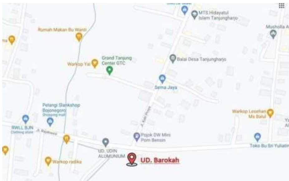
Gambar 1. Denah Lokasi UMKM UD. Barokah (UD Barokah, 2021)

Denah lokasi dapat dilihat pada gambar 1.