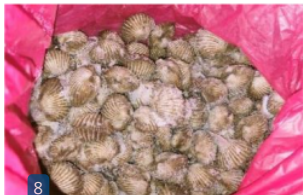
8 Gambar 2. Kerang darah ( Anadara granosa )

6 analisis logam berat pada kerang dapat dilihat dalam Tabel 1.