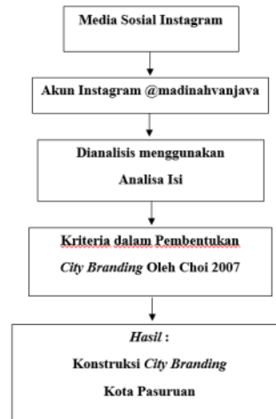
Tabel 1 Kerangka Berpikir

Kerangka berpikir pada penelitian ini yaitu sebagai berikut :