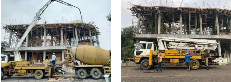
Gambar 2. 2 Proses Pengecoran Lantai 3

Pada saat awal kelompok kami melakukan Praktek Profesi kondisi Proyek Masjid Bata Lego suda masuk ke Tahap kedua. Untuk tahap kedua sendiri sudah masuk ke bagian pemasangan dan pengecoran atap tumpang sari. Untuk jangka waktu pembangunan Masjid Al Fattah tersebut sudah hampir melewati 3 tahun dan sempat berhenti satu tahun. Pada pekerjaan tahap pertama suda memasuki proses pemasangan struktur Pondasi hingga kontruksi plat lantai dan kolom seperti pada gambar dibawah ini.