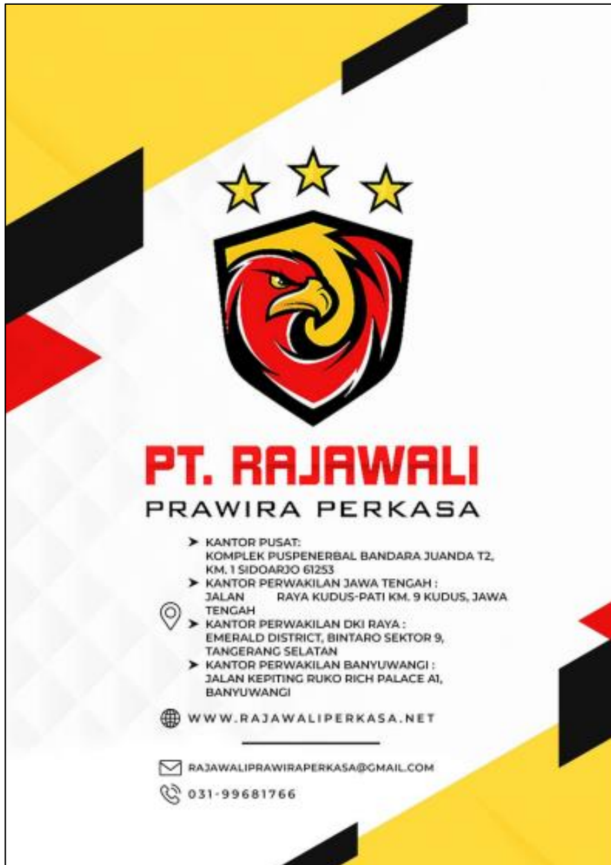
Gambar 8.6 Company Profile PT. Rajawali Prawira Perkasa Contact dan Alamat