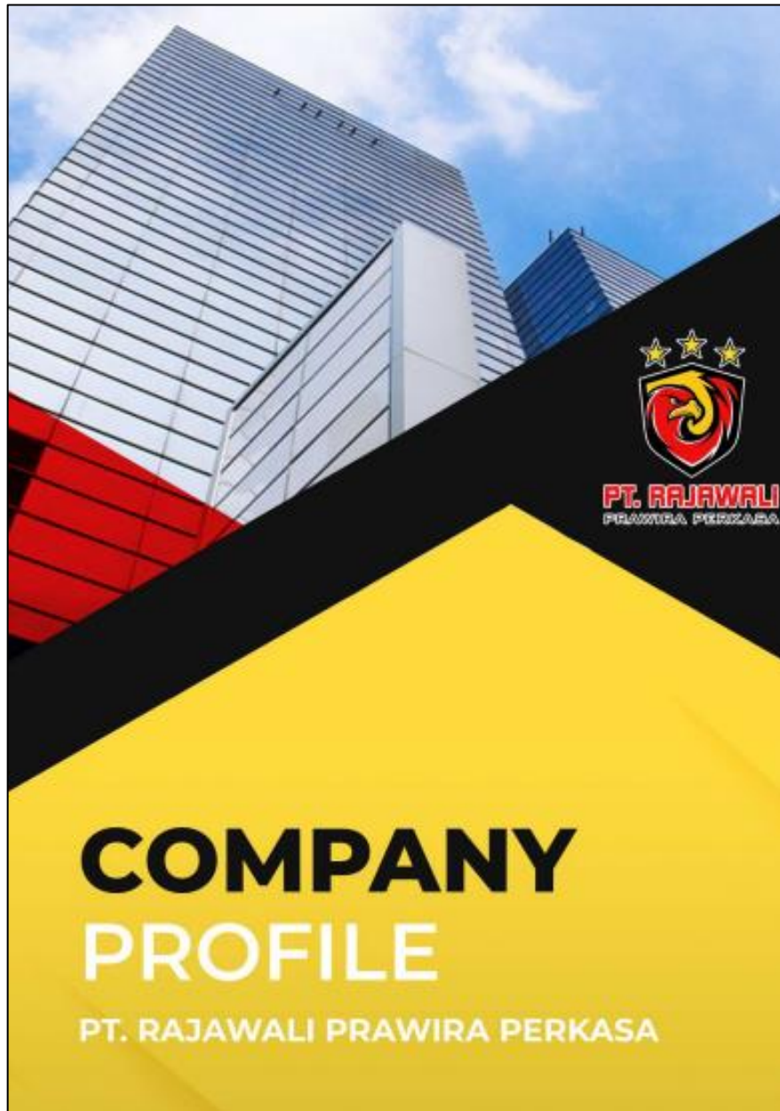
Gambar 8.1 Company Profile PT. Rajawali Prawira Perkasa Cover