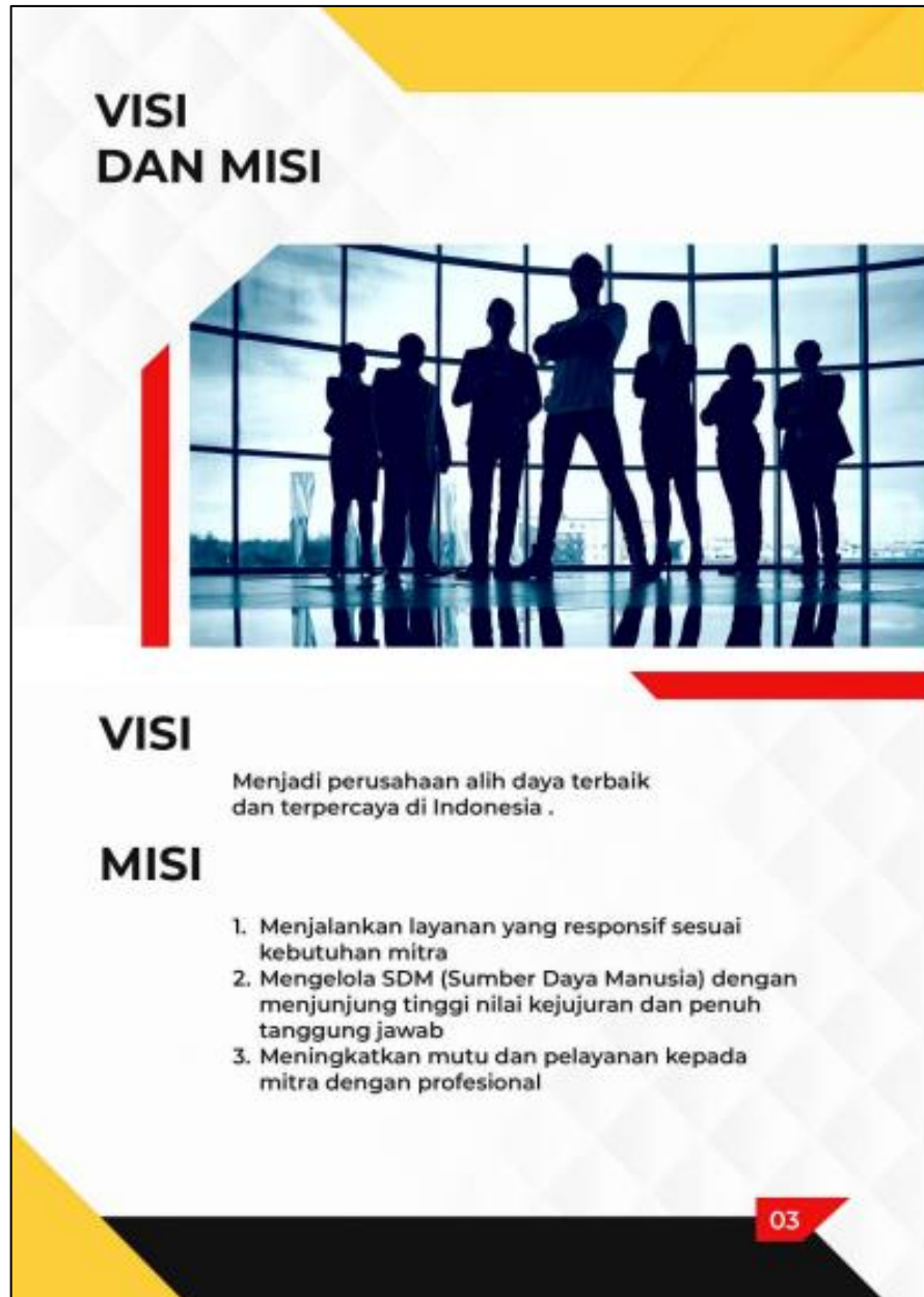
Gambar 8.4 Company Profile PT. Rajawali Prawira Perkasa Visi dan Misi