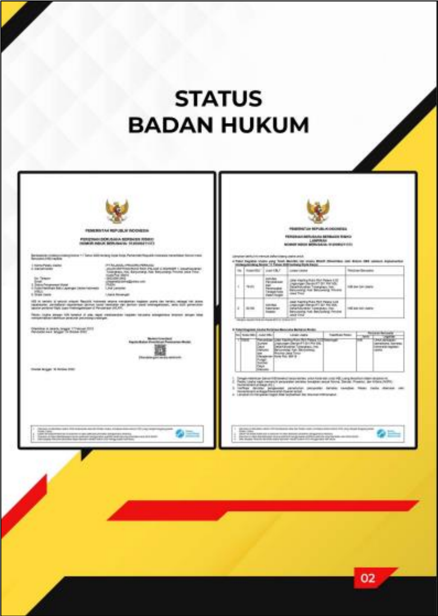
Gambar 8.3 Company Profile PT. Rajawali Prawira Perkasa Status Badan Hukum