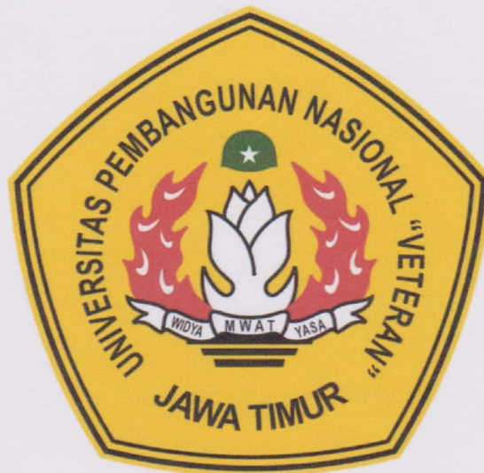
Gambar 2. 1 UPN Veteran Jawa Timur