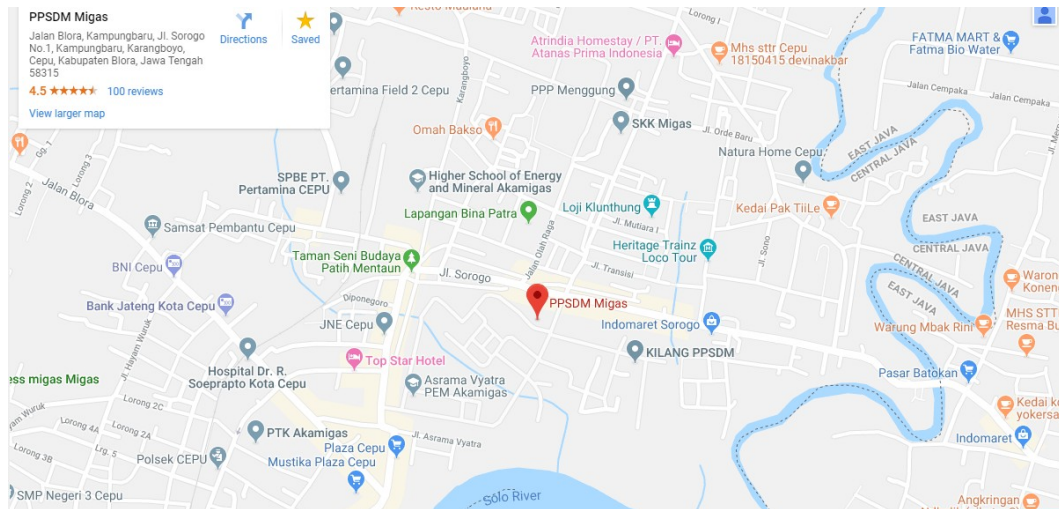
Gambar I.1 Peta Lokasi PPSDM Migas Cepu