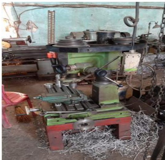
Gambar 5. Mesin frais