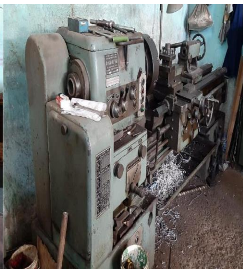
Gambar 8. Mesin sekrup