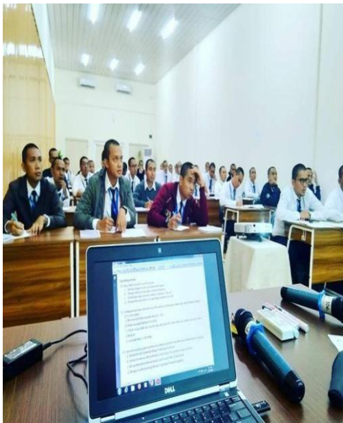
Gambar 10. Uji tes perekrutan