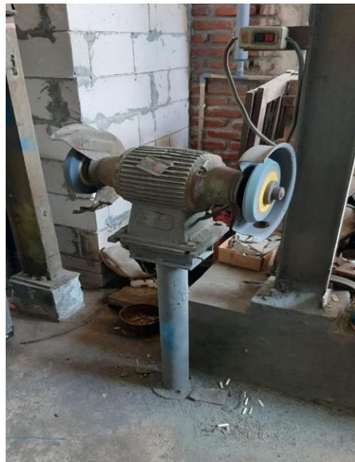
Gambar 3. Mesin Gerinda penghalus