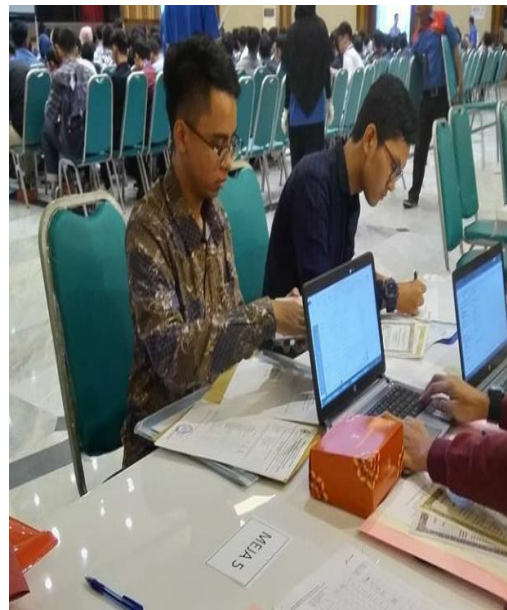
Gambar 11. Validasi karyawan baru