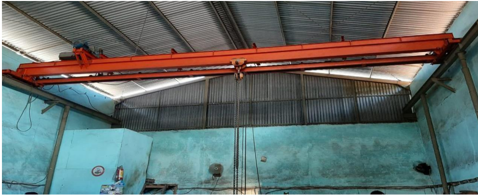
Gambar 4. Mesin Crain