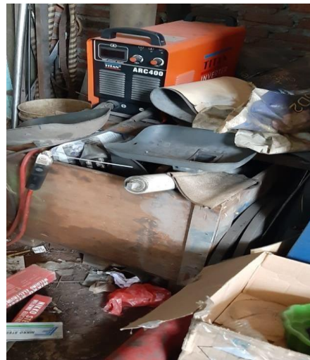
Gambar 6. Mesin las