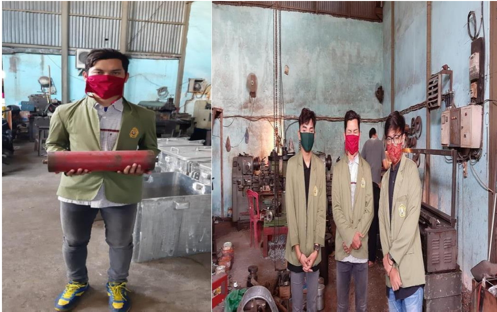
Gambar 1. Kegiatan Praktek kerja lapang