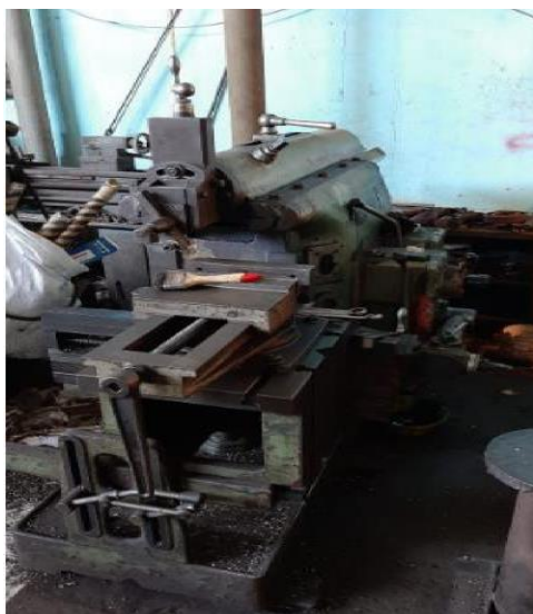
Gambar 7. Mesin bubut