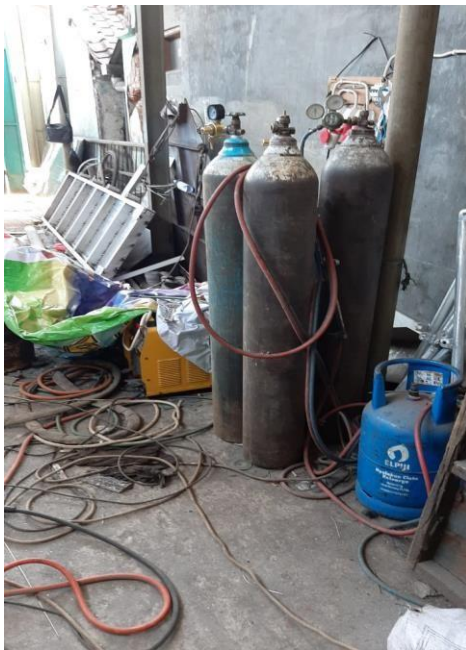
Gambar 2. Tabung Oksigen