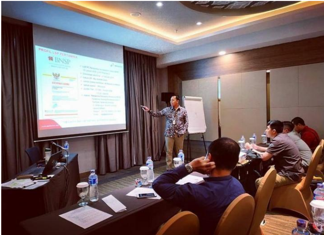
Gambar 12. Pelatihan Work Shop