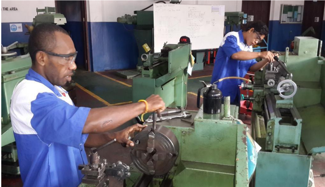
Gambar 9. Pelatihan permesinan manufaktur