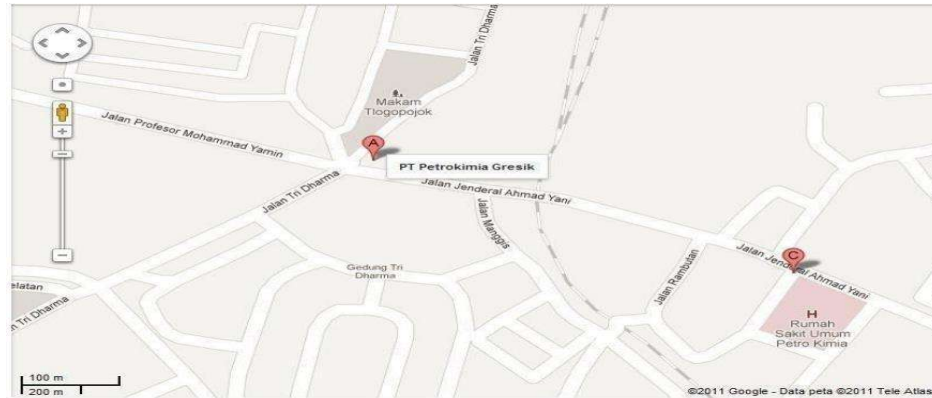
Gambar 1.1 Peta Lokasi PT Petrokimia Gresik

PT Petrokimia Gresik berlokasi di Kabupaten Gresik dan menempati lahan kompleks seluas 450 hektar di Area Kawasan Industri Gresik. Area tanah yang ditempati berada di tiga kecamatan meliputi 11 desa, yakni: