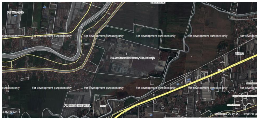
Gambar I.1 Tata Letak PT. Asahimas Flat Glass, Tbk