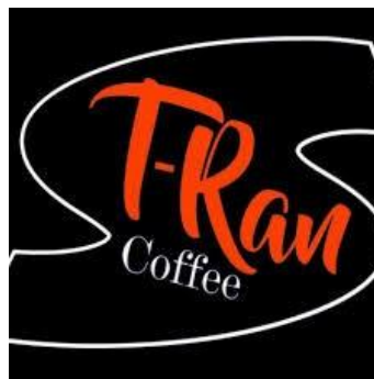
Gambar 1.1 Logo T-Ran Coffee Sumber: UMKM T-Ran Coffee (2020)

Logo T-Ran Coffee yang digunakan saat ini dapat dilihat pada Gambar 1.1. Logo tersebut telah digunakan sejak awal berdirinya T-Ran Coffee hingga sekarang tanpa adanya perubahan atau pergantian logo.