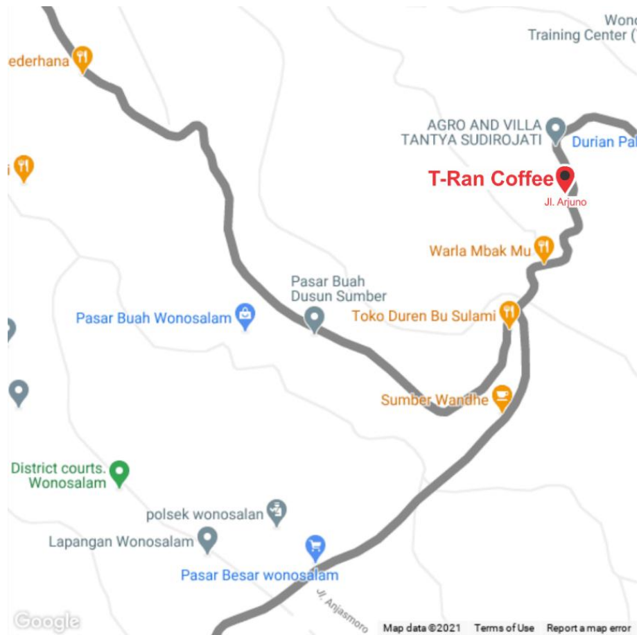
Gambar 1.2 Denah Lokasi UMKM T-Ran Coffee