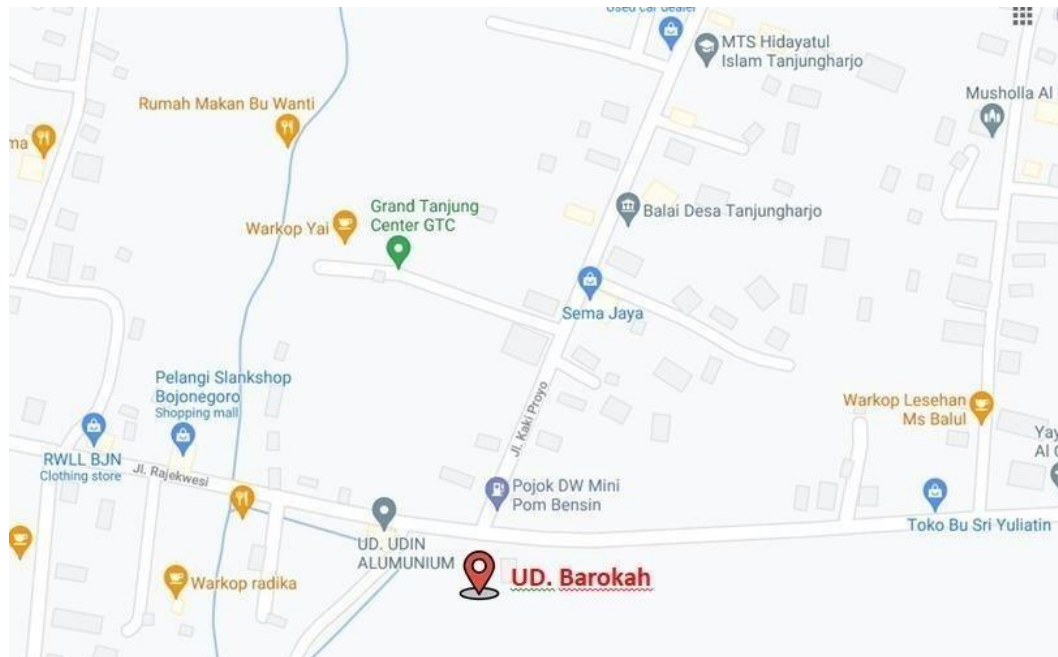
Gambar 1. Denah Lokasi UMKM UD. Barokah (UD Barokah, 2021)

Denah lokasi dapat dilihat pada gambar 1.