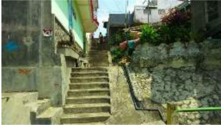
Gambar 7: Tangga Dorowati di Kampoeng Kajoetangan

Tangga Dorowati merupakan salah satu daya tarik di kampoeng Heritage. Para wisatawan menyebutnya tangga 1000 karena jumlah anak tangga yang banyak dan curam. Tangga ini bisa diakses wisata dari arah Barat yaitu Jl Dorowati.