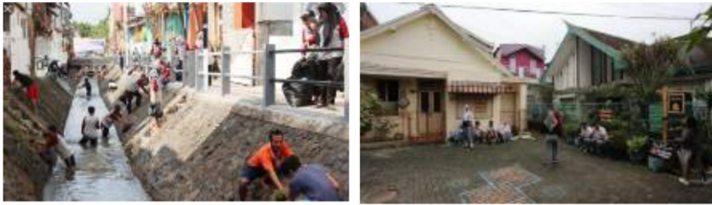
Gambar 14: Kegiatan warga dalam kegiatan sosial

Kampoeng Heritage Kajoetangan saat ini menjadi kampoeng tematik tidak lepas dari campur tangan warga setempat melalui Kelompok Sadar Wisata (POKDARWIS). Kelompok tersebut merupakan perwakilan warga yang menjadi jembatan dalam diskusi antara Pemkot Malang dengan warga. Sehingga warga ikut dilibatkan dalam melestarikan kawasan tersebut. Anggota Pokdarwis terdiri atas tiga rukun warga (RW), yaitu RW 1, RW 9, RW 10 dan baru bergabung RT 02. Pokdarwis Kajoetangan terus membenahi kampoeng sembari meningkatkan sumber daya manusianya.