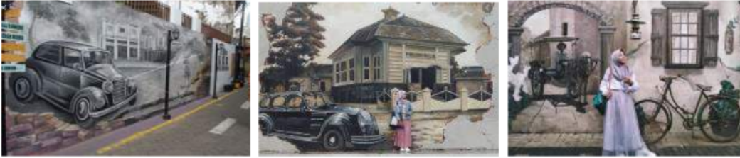
Gambar 12: Mural di Kampoeng Kayoetangan

Mural menjadi salah satu daya tarik dari kampoeng heritage Kajoetangan. Keberadaan mural menjadi obyek fotografi para pengunjung. Tema mural yang idpilihi disesuaikan dengan tema tempo doloe kota Malang.