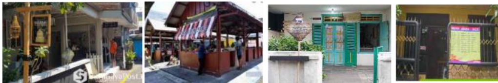
Gambar 18: Kegiatan ekonomi warga

Karakter kampoeng kota yaitu banyak hadir kegiatan ekonomi yang dilakukan oleh warganya. Kegiatan ekonomi yaitu dengan memanfaatkan hunian sekaligus sebagai tempat untuk berjualan. Sehingga keberadaan toko ataupun tempat makan banyak ditemui di kampoeng tersebut.