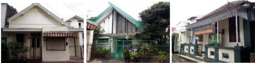
Gambar 4: Hunian di kampoeng Kajoetangan yang menggunakan style jengki