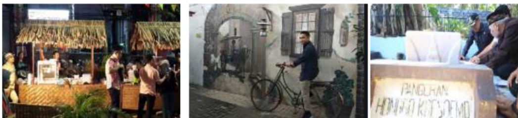
Gambar 16: Kegiatan Wisatawan

Kampoeng Kajoetangan merupakan salah satu kampoeng tematik di Kota Malang, sehingga banyak wisatawan lokal dan asing yang berkunjung. Kegiatan yang sering dilakukan oleh wisatawan yaitu menelusuri sejarah kampoeng Kajoetangan dengan melihat sekaligus memotret rumah-rumah style jengki, wisatawan juga biasanya melakukan wisata belanja dengan membeli kerajinan khas kampoeng Kajoetangan, menikmati hidangan yang dijual warga setempat sekaligus berzilah pada makam mbah Honggo.