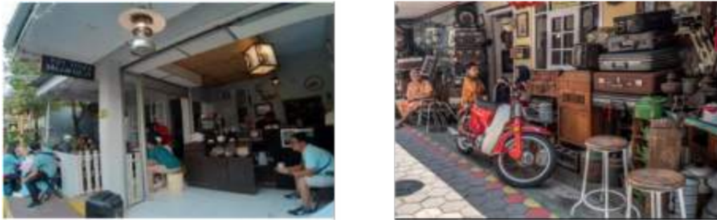
Gambar 9: Café dan gallery tematik