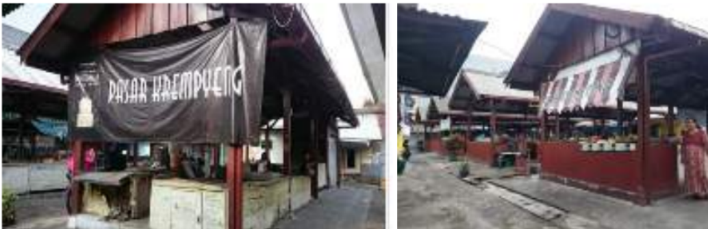
Gambar 5: Pasar Krempyeng

Pasar Krempyeng Kota Malang ternyata memiliki cerita menarik yang menjadi bagian sejarah perkembangan Kota Malang. Pasar Krempyeng atau Pasar Talun ini diperkirakan dibangun bersamaan dengan pembangunan beberapa pasar pembantu Kotapraja Malang yang dimulai tahun 1919, melingkupi pembangunan Pasar Bunulrejo, Pasar Klojen, Pasar Kebalen, Pasar Oro-Oro Dowo, Pasar Embong Brantas, dan Pasar Lowokwaru (Fathony, dkk. 2019). Namun, menurut versi lain keberadaan Pasar Krempyeng sudah ada sejak jaman Mbah Honggo. Pasar berada di tengah kepadatan penduduk Kajoetangan itu berlokasi di RW 01, kelurahan Kauman ini memiliki 3 los yang menempati area kurang lebih 50 x 30meter persegi, terdiri dari 40 bedak.