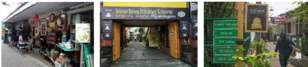
Gambar 3: Kampong Kajoetangan masa kini

Potensi tersebut menjadi daya tarik untuk dikembangkan dalam kampong tematik sehingga identitas dari kampong Kajoetangan tidak akan hilang.