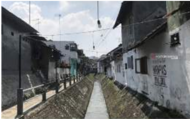
Gambar 8: Saluran drainase peninggalan Belanda

Wilayah Talun dibelah sungai kecil yang kemungkinan sungai ini merupakan saluran drainase primer, yang pernah direvitalisasi pada masa kolonial. Alirannya mulai dari ujung timur Oro-oro Dowo hingga bermuara di Kali Kasin. Saluran drainase ini memiliki aliran yang lurus dengan arah Utara-Selatan.