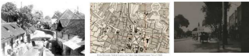
Gambar 2: Kampong Kayoetangan tempo dulu; Peta kampong Kayoetangan jaman kolonial; Koridor jalan Kayoetangan jaman kolonial

Hal ini dibuktikan dengan peninggalan yang dapat ditemui di kawasan ini yaitu bangunan-bangunan peninggalan Belanda masih dipertahankan bentuk aslinya terutama bentuk asli rumah dan pertokoan di perkampungan Kajoetangan.