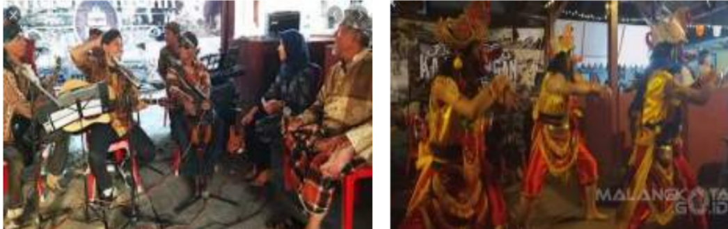
Gambar 17: Kegiatan Budaya

Pada kampoeng Kajoetangan kegiatan yang berhubungan dengan kebudayaan masih sering ditemukan. Seni keroncong dan seni tari masih sering melakukan pertunjukan. Pertunjukan ini merupakan bagian dari agenda wisata kampoeng Kajoetangan. Kegiatan ini biasanya dilaksanakan di pasar krempyeng, wisatawan bisa berbelanja sekaligus menikmati pertunjukan tersebut.