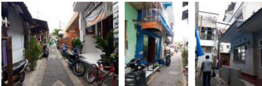
Gambar 11: Kampoeng Kayoetangan kampung padat penduduk

Kampoeng Kajoetangan merupakan kampoeng padat penduduk yang lokasi tepat di jantung Kota Malang. Karakter kampoeng padat penduduk pada umumnya sama dengan karakter kampoeng Kajoetangan yaitu minimnya ketersediaan ruang public dan minimnya fasilitas umum. Akses masuk utama pada kampoeng Kajoetangan melalui gang-gang kecil yang hanya bisa diakses dengan sepeda motor dan pejalan kaki. Ruang public yang tersedia hanya berupa gang, sehingga gang digunakan sebagai jalur sirkulasi, social dan utilitas.