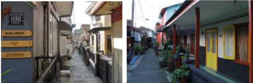
Gambar 10: Hunian di kampoeng Kajoetangan yang menggunakan style jengki

Ruang public menjadi bagian yang tidak terpisahkan pada kawasan kampoeng padat penduduk. Ruang public menjadi ruang social yang juga menjadi pusat kegiatan warga. Ruang public yang mendominasi pada kampoeng Kajoetangan berupa gang. Gang menjadi area sirkulasi sekaligus ruang social dan utilitas. Keterbatasan ruang terbuka di kampoeng padat penduduk menjadikan gang sebagai satu-satunya ruang public yang dapat mewadahi aktivitas social warga.