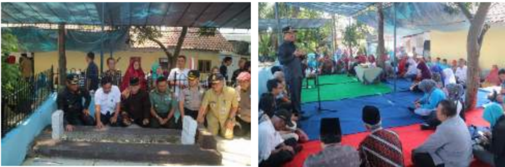
Gambar 13: Kegiatan ziarah di makam Mbah Honggo dan bersih kampoeng di Kampoeng Kajoetangan

Selain kegiatan ziarah kegiatan bersih kampoeng juga biasanya dilaksanakan di makam Mbah Honggo Kusumo yang juga dihadiri oleh banyak orang. Kegiatan bersih kampoeng yaitu kegiatan tahunan yang memang bertujuan untuk memberi keselamatan semua warga kampoeng.