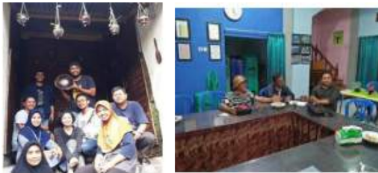
Gambar 15: Kegiatan POKDARWIS

Kampoeng Heritage Kajoetangan saat ini menjadi kampoeng tematik tidak lepas dari campur tangan warga setempat melalui Kelompok Sadar Wisata (POKDARWIS). Kelompok tersebut merupakan perwakilan warga yang menjadi jembatan dalam diskusi antara Pemkot Malang dengan warga. Sehingga warga ikut dilibatkan dalam melestarikan kawasan tersebut. Anggota Pokdarwis terdiri atas tiga rukun warga (RW), yaitu RW 1, RW 9, RW 10 dan baru bergabung RT 02. Pokdarwis Kajoetangan terus membenahi kampoeng sembari meningkatkan sumber daya manusianya.