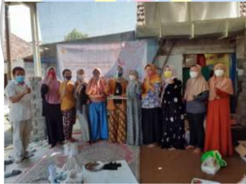
Gambar 3. Peserta Kegiatan Pelatihan Desain Kemasan Desa Sawohan Sidoarjo

Kegiatan ini merupakan kegiatan pemberdayaan UMKM khususnya UMKM AABA di Desa Sawohan Sidoarjo yang bertujuan untuk membangkitkan potensi UMKM Desa Sawohan. Hal ini dikaitkan juga dengan permasalahan dari desa Sawohan yang kemasan produk olahan bandengnya masih belum bagus. Tahapan yang dilakukan dalam kegiatan ini adalah penyuluhan dan pelatihan. Pada saat penyuluhan dan pelatihan peserta yang terdiri dari ibu ibu UMKM ini sangat antusias dan menyimak serta berinteraksi aktif. Pada saat pelatihan jumlah peserta dibatasi dan diharuskan sesuai dengan protokol kesehatan karena pelaksanaannya dimasa pandemic agar tetap bisa menjaga jarak