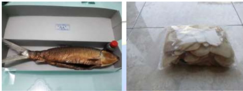
Gambar 2. Contoh produk bandeng dengan kemasan kerdus warna putih oleh UD AABA

Perkembangan home industri secara tidak langsung akan bisa meningkatkan perekonomian rumah tangga. Usaha Mikro, Kecil, dan Menengah juga mampu bertahan pada masa krisis ekonomi nasional. UMKM bahkan mampu menyediakan lapangan pekerjaan, barang-barang murah, dan melahirkan wirausaha-wirausaha baru. Perkembangan UMKM mengalami beberapa masalah salah satunya adalah masalah pemasaran khususnya terkait branding (Sudarwati & Eka Satya, 2013). Sekarang ini banyak bermunculan industri kecil yang menghasilkan berbagai produk yang tidak kalah kualitasnya salah satunya industri hasil tambak di Desa Sawohan Sidoarjo. Menurut hasil wawancara bahwa saat ini terdapat kurang lebih 10 pengrajin produk hasil tambak di Desa Sawohan Sidoarjo dan salah satunya UD. AABA yang merupakan salah satu pengrajin yang sudah berdiri lama dan menghasilkan antara lain produk bandeng presto, bandeng crispy, bandeng tanpa duri, kerupuk udang, kerupuk payus dll.