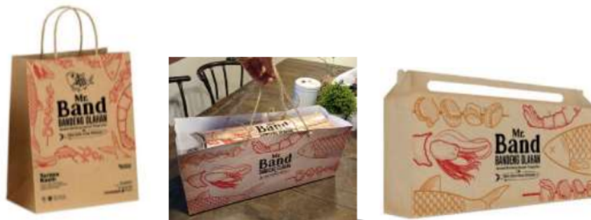
Gambar 9. Kemasan tersier isi 3

Kemasan ini dibuat untuk apabila pelanggan yang membeli dalam jumlah sedikit dan agar mudah membawa produk bandeng, ditujukan untuk menampung 1 sampai 3 kemasan sekunder. Kemasan ini menggunakan material craft paper ukuran tebal. Dari segi desain sama seperti kemasan utama bandeng, yang bertujuan untuk menyelaraskan kemasan. Ada 3 desain yang dihasilkan pada kemasan tersier isi maksimal 3 ini, antara lain bentuk tas, box terbuka dan box tertutup.