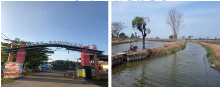
Gambar 1. Gerbang dan suasana tambak Desa Sawohan Sidoarjo