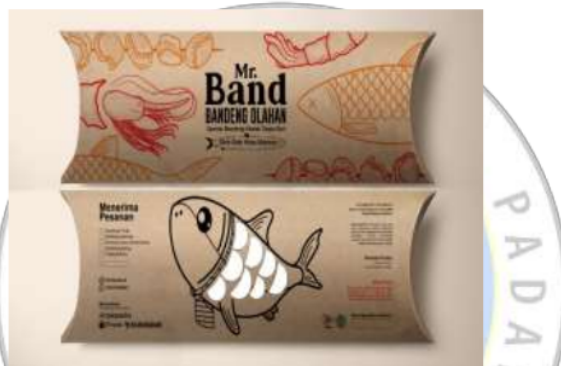
Gambar 8. Kemasan sekunder baru Mr.BAND

Sedangkan untuk pembelian satuan disediakan tali untuk memudahkan pembeli membawa produk bandeng nya. Tali ini berbahan goni yang cukup kuat dengan penampilan unik dan menarik