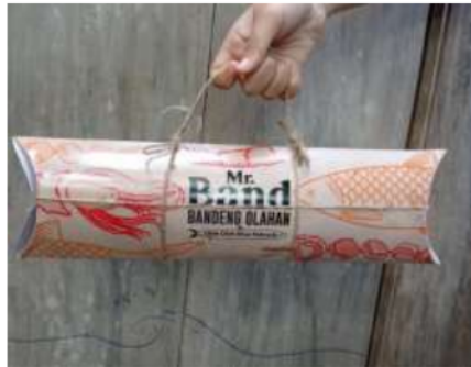
Gambar 4. Kemasan Kemasan Baru Produk Olahan Bandeng Desa Sawohan Sidoarjo

Untuk keberlanjutan dari pelaksanaan desain dan percetakan ini CV AABA dalam jangka panjang akan merekrut SDM yang mengerti tentang desain untuk lebih memperkuat branding produk seiring peningkatan penjualan. Sedangkan saat ini mereka masih dalam pendampingan tim pelatih sampai ke percetakan. Sedangkan biaya yang di butuhkan untuk percetakan bisa di sediakan oleh CV AABA dikarenakan memang kemasan yang lama sudah akan habis. Untuk saat ini belum diadakan kerjasama dengan percetakan karena masih dalam tahap percobaan dan melihat respon pasar. Untuk harga satuan kemasan masih terjangkau oleh pengusaha bandeng dengan perkiraan harga 5.600 per kemasan. Sedangkan rencana harga jual produk bandeng re branding ini adalah sekitar 75.000-125.000 karena rebrandingnya sekaligus pada produknya yaitu khusus di bandeng yang besar, sehingga juga akan mengangkat harga jual serta focus pada produk oleh-oleh.