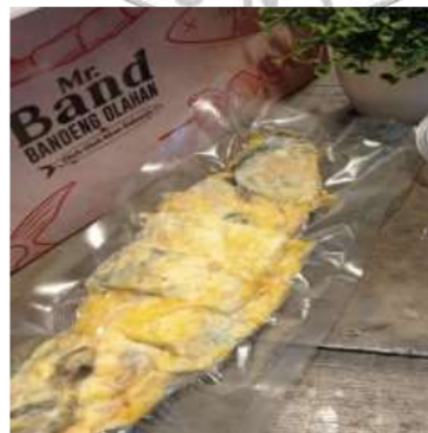
Gambar 7. Kemasan primer ( primary pack )

Berupa kemasan plastik yang di vakum dengan maksud agar lebih higienis serta lebih tahan lama. Metode pengemasan vakum merupakan metode kemasan dengan menghilangkan udara atau oksigen dengan menggunakan plastik khusus. Hal ini dimaksudkan agar pada saat oksigen dikeluarkan maka akan membatasi pertumbuhan bakteri aerobik dan tidak akan mudah basi sehingga akan memperpanjang waktu kadaluarsa (Purnamayati, Wijayanti, Dwi Anggo, Amalia, & Sumardianto, 2018). Jenis plastik yang digunakan adalah jenis nylon. Plastik nylon mempunyai tingkat elastisitas dan daya kerat yang kuat sehingga tidak mudah bocor. Dengan penggunaan plastik vakum ini maka produk olahan bandeng akan lebih awet, health, higienis dan akan menambah daya tarik dan keunggulan produk. Selain itu dengan produk yang bisa lebih tahan lama maka akan dapat menekan kerugian akibat produk yang tidak laku terjual.