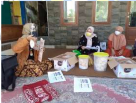
Gambar 5. Suasana Pelatihan Desain Kemasan Desa Sawohan Sidoarjo

Untuk keberlanjutan dari pelaksanaan desain dan percetakan ini CV AABA dalam jangka panjang akan merekrut SDM yang mengerti tentang desain untuk lebih memperkuat branding produk seiring peningkatan penjualan. Sedangkan saat ini mereka masih dalam pendampingan tim pelatih sampai ke percetakan. Sedangkan biaya yang di butuhkan untuk percetakan bisa di sediakan oleh CV AABA dikarenakan memang kemasan yang lama sudah akan habis. Untuk saat ini belum diadakan kerjasama dengan percetakan karena masih dalam tahap percobaan dan melihat respon pasar. Untuk harga satuan kemasan masih terjangkau oleh pengusaha bandeng dengan perkiraan harga 5.600 per kemasan. Sedangkan rencana harga jual produk bandeng re branding ini adalah sekitar 75.000-125.000 karena rebrandingnya sekaligus pada produknya yaitu khusus di bandeng yang besar, sehingga juga akan mengangkat harga jual serta focus pada produk oleh-oleh.