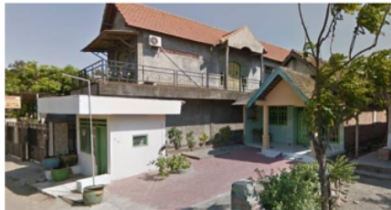
Gambar 7. Kerelaan “ruang” di Desa Keboansikep pada tahun 2014

Bangunan – bangunan modern ini biasanya merupakan warga bukan kelahiran desa, maupun keturunan warga desa yang telah menikah dan berumah-tangga dengan warga daerah lain. Walaupun memiliki pagar tinggi, beberapa hunian masih memiliki jarak sempadan yang cukup panjang dari dinding rumah. Hal ini kemudian menjadi menarik ketika pola – pola hunian yang berkembang modern ini kemudian masih memiliki “nyawa” pedesaan yang kental, salah satunya adalah prinsip rela berkorban (Gambar 7).