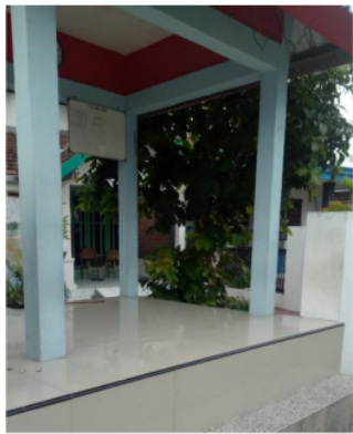
Gambar 9. View Pos Ronda dari jalan ke arah rumah