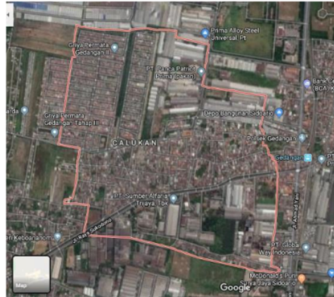
Gambar 2. Siteplan Desa Keboansikep

Desa Keboansikep sendiri merupakan desa yang terletak di utara Kabupaten Sidoarjo, Jawa Timur, berbatasan dengan Surabaya. Desa ini merupakan Desa yang tumbuh secara modern dan berkembang mengikuti arus industrialistik, dengan luasan desa yang cukup besar.