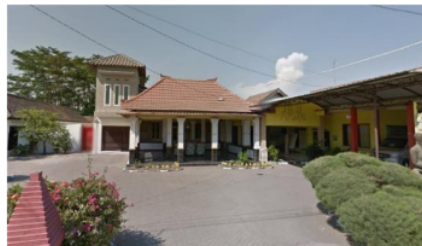
Gambar 5. Tipologi Bangunan Indis di Desa Keboananom

Pola – pola hunian awal yang berbentuk adalah pendhapa Joglo Jawa yang hanya dimiliki oleh kalangan tertentu, dalam hal ini perangkat desa yang setingkat Lurah. Lurah yang bekerjasama dengan Belanda ini kemudian menghasilkan tipologi hunian yang terdapat akulturasi di dalamnya dan sedikit campuran indis dan Jawa (Gambar 5).