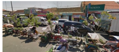
Gambar 3. Area Parkir Becak Desa Keboansikep

Pertumbuhan di kota berpangkal dari peningkatan populasi baik secara alami maupun berupa arus urbanisasi yang menyebabkan peningkatan permintaan ruang ( space ) yang tinggi (Nugroho, 2009). Okupansi ruang yang telah ada kemudian bergeser karena ruang-ruang yang ada ini harus berbagi dengan fungsi dan kegunaan ruang yang lain. Ruang yang ada pada jalan kemudian harus berbagi dengan pasar senggol, PKL, dan juga parkir becak (lihat Gambar 3)