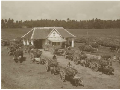
Gambar 4. Pengangkutan Gula di Kecamatan Buduran, Sidoarjo