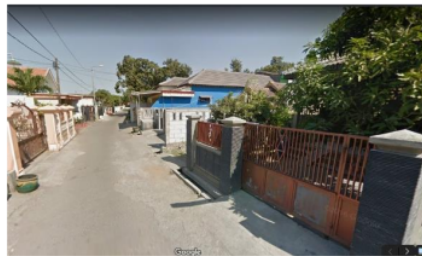
Gambar 6. Tipologi Bangunan Modern di Desa Keboansikep

Pola – pola hunian awal ini menyediakan ruang yang cukup besar pada sempadan jalan, yang mana menjadi ciri khas masyarakat pedesaan saat itu. Jarak sempadan bangunan yang lebar (10-12m) menjadikan area hunian memiliki halaman. Ciri lain masyarakat Desa Keboansikep adalah penggunaan pagar halaman