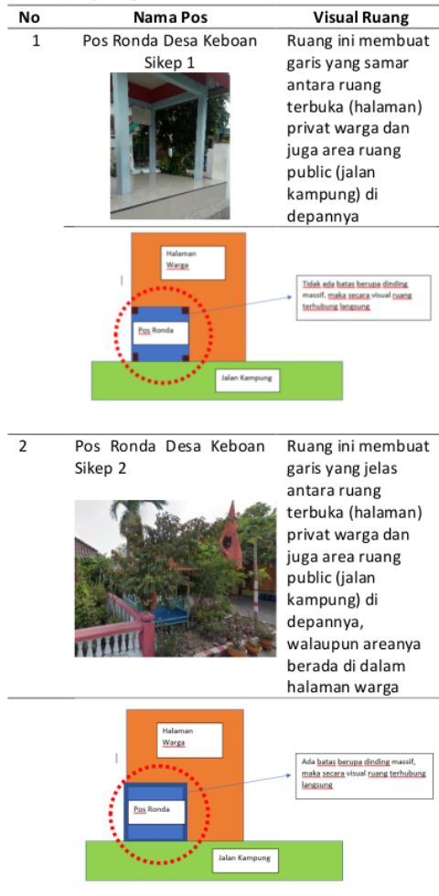
Tabel 1. Tipologi Pos Ronda