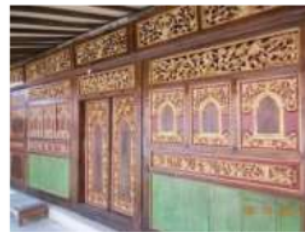
Gambar 10: rumah material gejug/kayu

Konsep ruang pada rumah induk dan rumah anak adalah konsep ruang tertutup sehingga pada rumah yang bermaterialkan gejug/kayu banyak menggunakan ventilasi udara menggunakan ornamen dengan motif organik/flora. Hal tersebut dikarenakan motif flora tersebut dipasang menumpuk sehingga terlihat tidak ada celah untuk bisa mengintip aktivitas yang dilakukan didalamnya walaupun sebenarnya terdapat celah-celah tak terlihat jelas sebagai ruang sirkulasi udara. Sedangkan pada rumah yang bermaterialkan batu bata telah sedikit mengalami perubahan dengan konsep awal karena sudah terdapat beberapa rumah yang menggunakan jendela sebagai ventilasi utama sehingga ornamen yang terdapat pada rumah ini tidaklah sebanyak yang ada pada rumah bermaterial gejug/kayu, hanya pada ventilasi diatas pintu, kusen jendela, dan sedikit di bagian pintu. Disamping perbedaan yang signifikan itu, motif ornamen pada pintu dan dinding memiliki keseragaman dengan motif pada ventilasi udara, baik itu pada rumah batu bata ataupun rumah gejug/kayu.