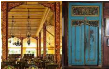
Gambar 3: ukiran daun sulur dan bunga pada kusen pintu(kiri) dan kolom (kanan)

Gambar-gambar tersebut menunjukkan bahwa motif oke! /daun sulur yang disertai dengan