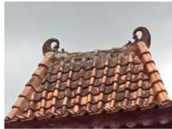
Gambar 4: rumah adat Bangsal

Terdapat pada hiasan bubungan yang saling berhadapan dan digunakan sebagai keindahan saja. Akan tetapi pada sekelompok keluarga yang religius, adanya motif ini pada atap rumah memunculkan sebuah simbolik yaitu sebagai gambaran batu nisan sehingga selalu mengingat kematian.