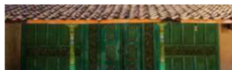
Gambar 11: Rumah material utama batu bata