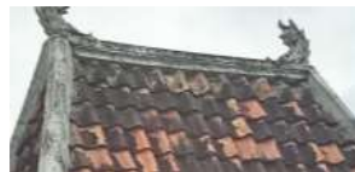
Gambar 5: atap rumah suku bangsal

Penggunaan ukiran dengan motif naga ini berada pada bagian atap. Ornamen bentuk ekor naga pada bubungan atap merupakan penanda status sosial pemilik rumah (Asmarani, 2016). Naga merupakan hasil akulturasi dengan budaya Cina yang mana memiliki makna keperkasaan dan dianggap sebagai penjaga rizki.