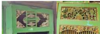
Gambar 9: motif flora-swastika (kiri), motif flora-fauna (kanan)

Motif gabungan terdiri dari motif-motif yang ada yakni motif flora dengan swastika maupun flora dengan fauna. Pada motif flora-swastika merupakan akulturasi kebudayaan dari Cina, Jawa hindu, dan Madura. Sedangkan motif flora-fauna merupakan motif hasil akulturasi Madura dan Cina.