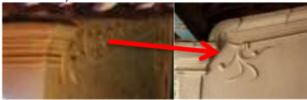
Gambar 12: relief pada dinding langgar Sumber Nailufar, 2015

Kobhung (Langgar) bagi masyarakat Madura memiliki peranan yang penting, tidak hanya didefinisikan sebagai ruang ibadah, namun langgar menjadi identitas Tanean Lanjang, hal ini tercerminkan dari pola aktivitas penghuni, dan bagaimana cara penghuni memperlakukan langgar (Heng & Kusuma, 2013). Pada bagian kobhung (langgar) mulanya menggunakan tabing (anyaman bambu) sebagai dindingnya sehingga tidak terdapat ornamen. Seiring berubahnya waktu hingga dindingnya telah menggunakan batu bata, kobhung sangat jarang terdapat ornamen (Nailufar, 2015). Yang ada hanyalah berupa relief sederhana berupa motif okel yang sangat sederhana (hanya berupa tangkai utama/tidak ada daun)