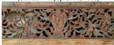
Gambar 2: motif ukiran tumbuhan sulur