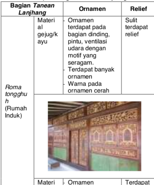
Tabel 2. Analisis Perbandingan Ornamen dan Relief pada Bagian Tanean Lanjang

Secara ringkas disajikan dalam tabel berikut: