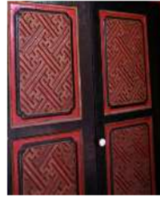
Gambar 8: motif geometris pada daun pintu di keraton Sumenep