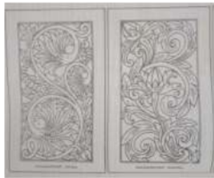
Gambar 1: motif ukiran Jepara (kiri), motif ukiran Madura (kanan)

Motif ini dapat dikatakan sebagai perkembangan dari motif Jepara karena bentuknya yang terkesan hampir sama. Yang membedakan keduanya adalah bentuk sulur daun muda yang melengkung dengan ujung daun bergelung/mengikal ( oke! ). Selain itu, pahatan yang berupa garis-garis pada ukiran daun merupakan hal lain yang membedakan antara motif Madura dengan Jepara. Biasanya motif ini disandingkan dengan motif bunga-bunga (Wiryoprawiro, 1986).