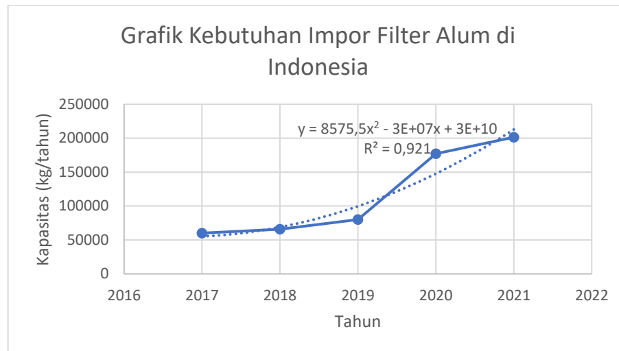
Gambar I. 1 Grafik Kebutuhan Impor Filter Alum di Indonesia

Berikut adalah data kebutuhan ekspor filter alum di Indonesia :