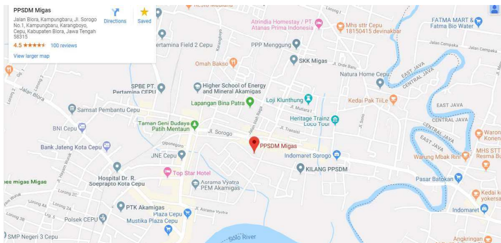
Gambar I.1 Peta Lokasi PPSDM Migas Cepu

Pusat Pengembangan Sumber Daya Manusia Minyak dan Gas Bumi berlokasi di Jalan Sorogo 1, Kelurahan Karangboyo, Kecamatan Cepu, Kabupaten Blora, Provinsi Jawa Tengah, Kode pos 58315. Luas area sarana dan prasarana seluas 129 hektar.