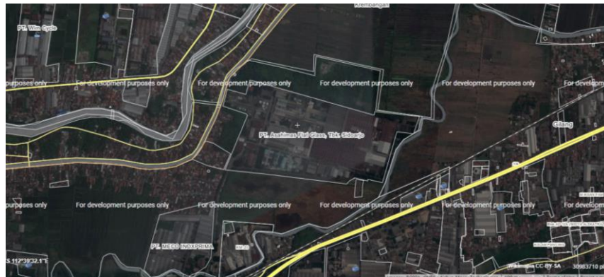
Gambar I.1 Tata Letak PT. Asahimas Flat Glass, Tbk